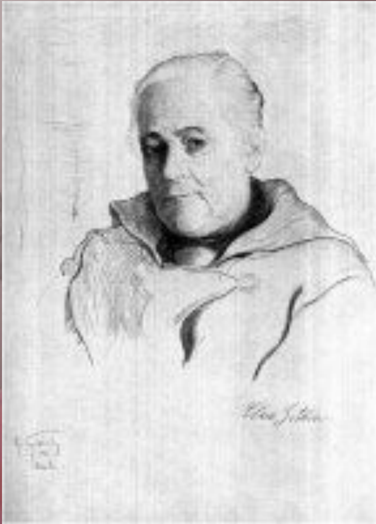
Клара Цеткин (Рисунок художника И. Бродского)