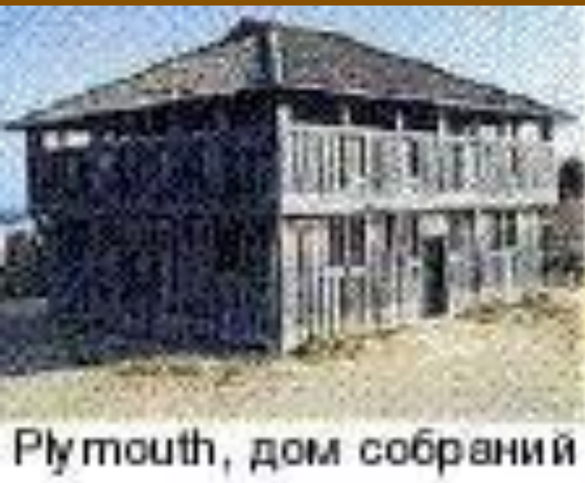
Plymouth, дом собраний