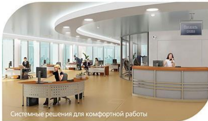
Системные решения для комфортной работы