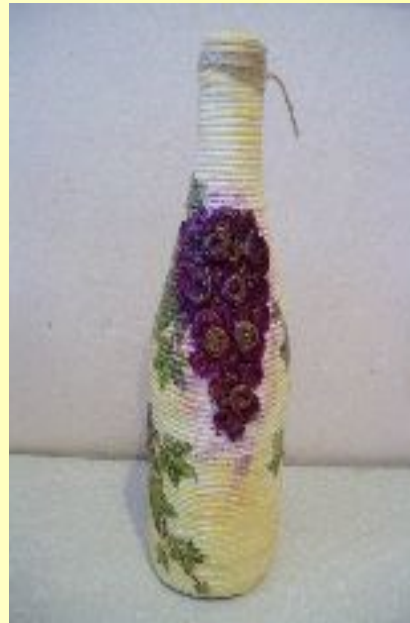
Декупаж, пэйп – арт, терра