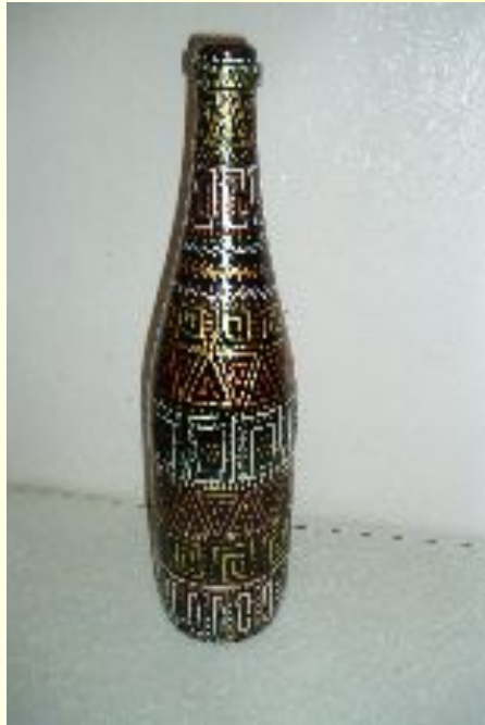
Point – to- Point