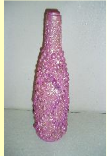
Терра с макаронными изделиями