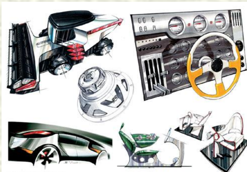
Студия дизайна Семёна Савкина