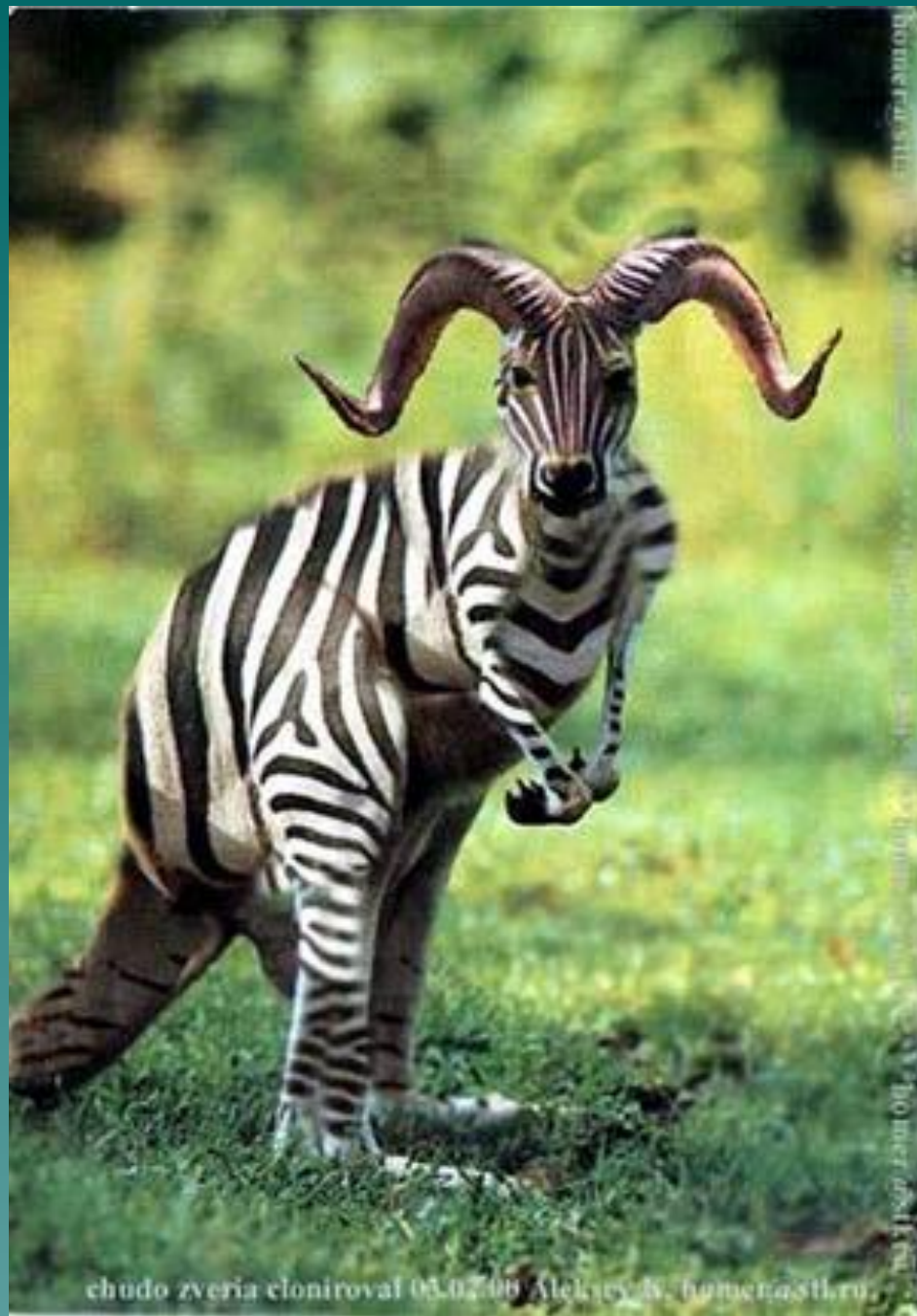
chudo zveria cloniroval 03.07.08 Aleksey N. Gumenastli.ru