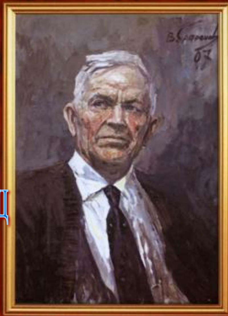
Пластов Аркадий Александрович