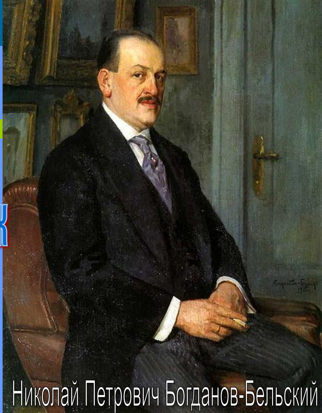
Николай Петрович Богданов-Бельский