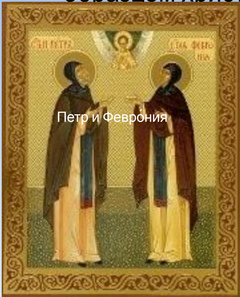
Пётр и Феврония