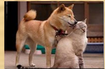
Кошка и собака