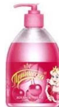
Жидкое детское мыло