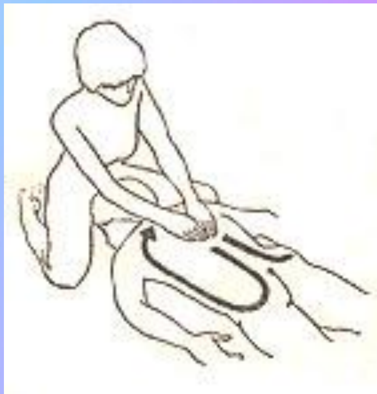
Длинные круговые движения