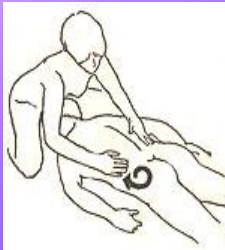
Широкие круговые движения