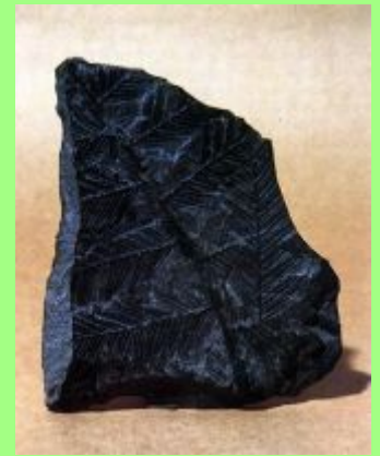
Каменны й уголь

Месторождение – скопление полезных ископаемых.