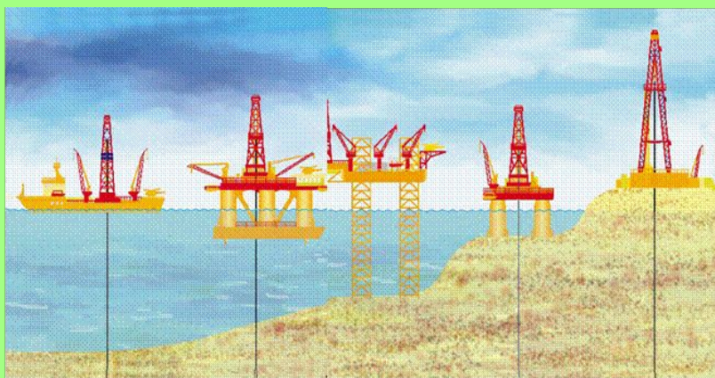
Рис. 4. Виды буровых скважин