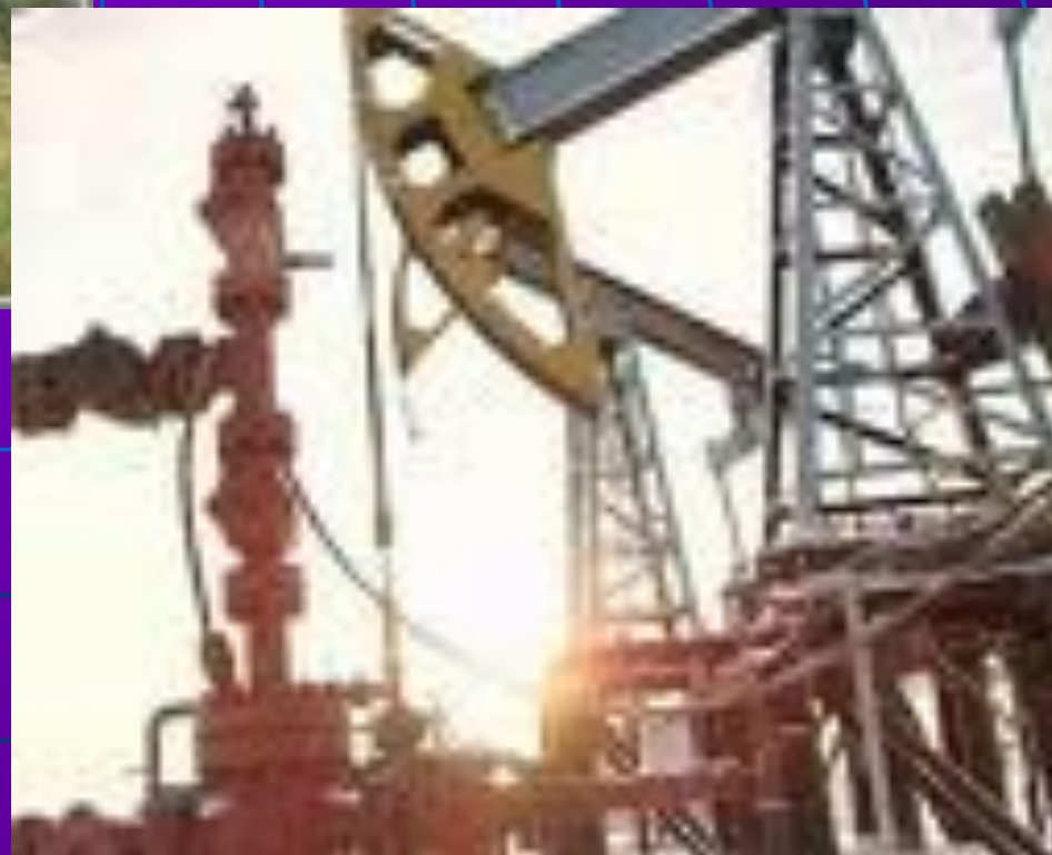
Станок – качалка нефти