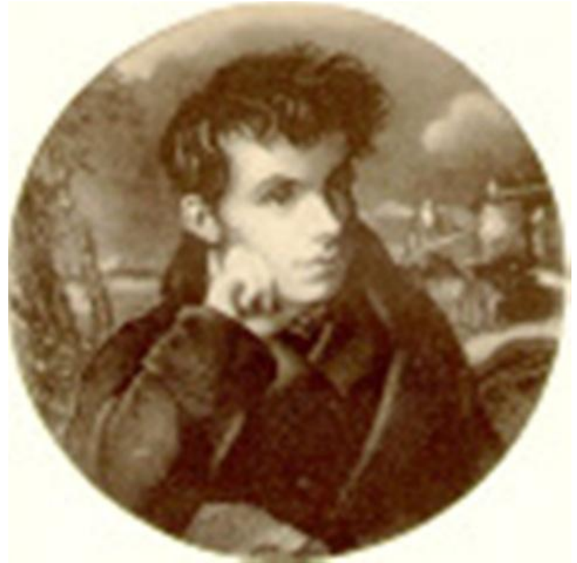
Василий Андреевич Жуковский. (1783 – 1852)

При мысли великой, Что я человек, всегда Возвышаюсь душой.