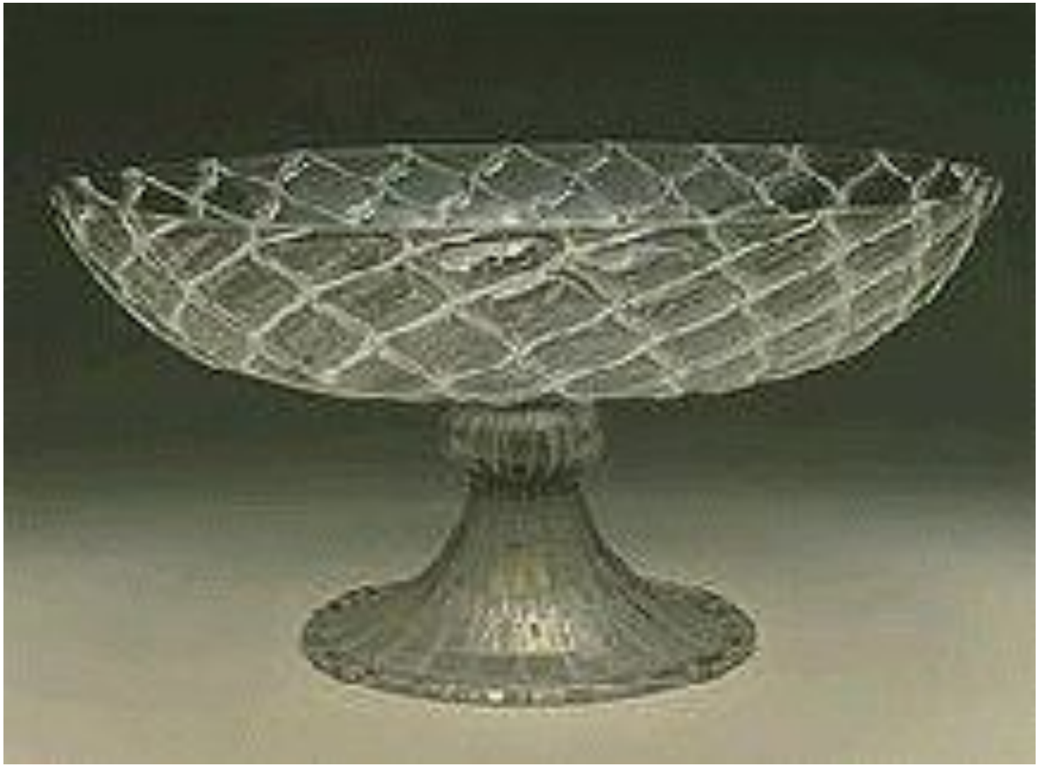
Чаша второй половины 16 века. Венеция, техника «ретичелло», то есть «сетка».