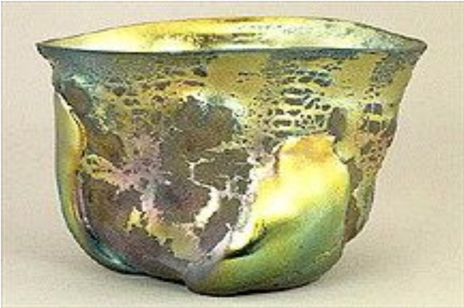
Чаша из стекла «фавриль» работы Л. К. Тиффани. 1908 год.