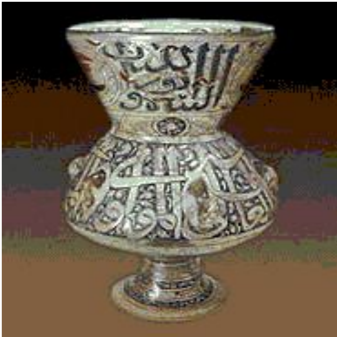
Дамасская лампа 14 века