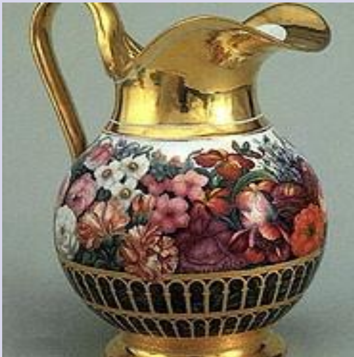
Кувшин. Фарфор, надглазурная роспись, золочение. Императорский фарфоровый завод. 1830-е годы.