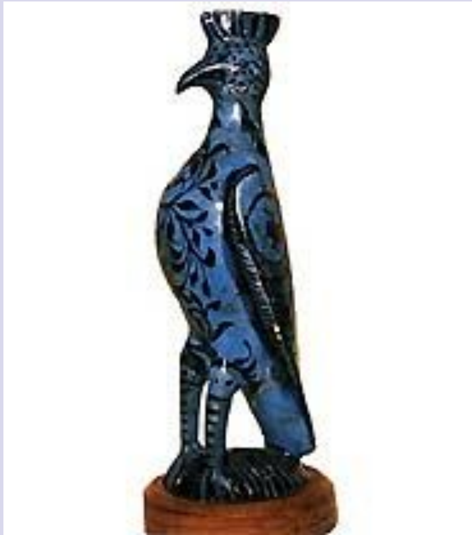
«Птица». Музей исламского искусства. Каир.