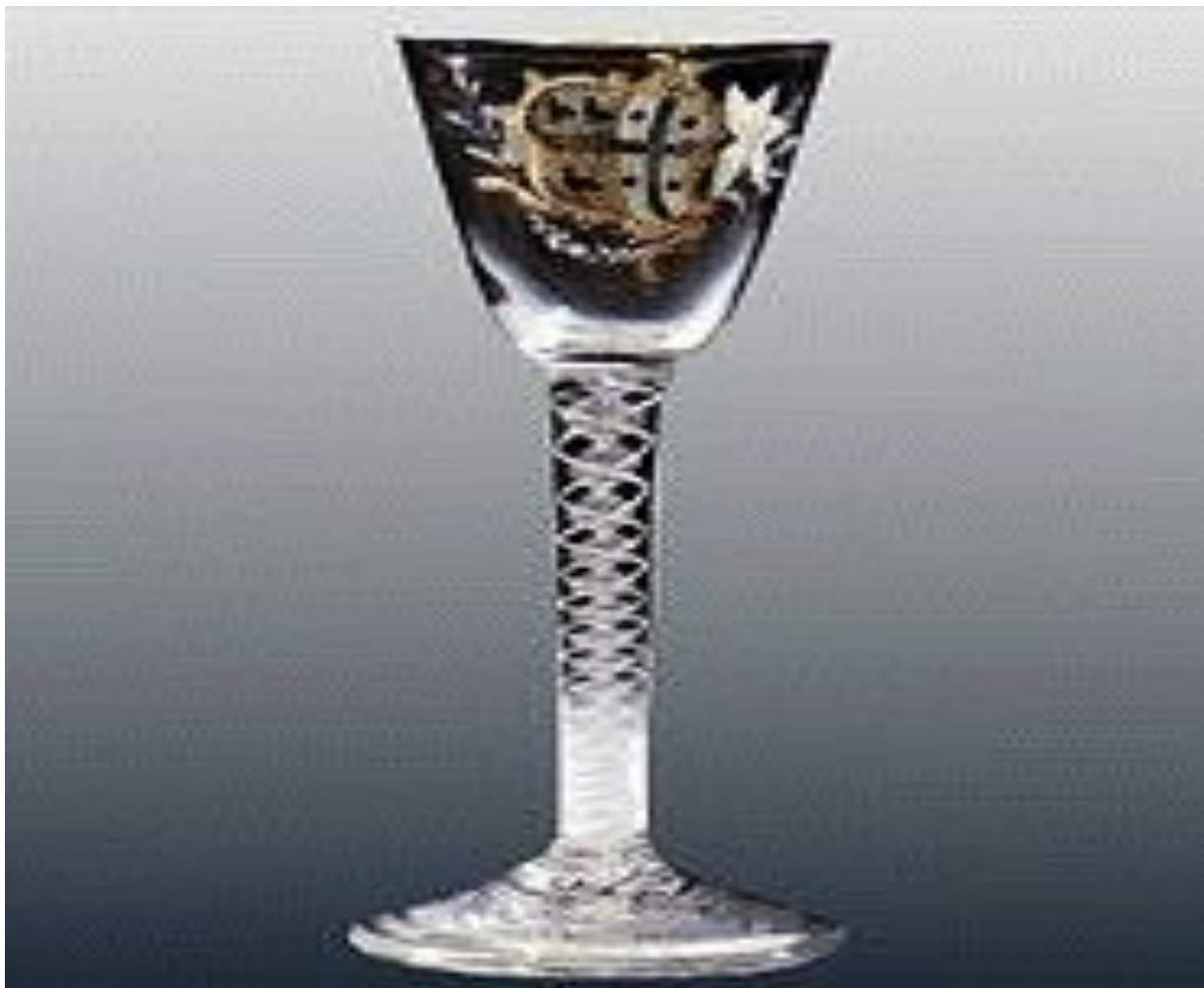
Английский бокал с гербом с эмалевой росписью в стиле рококо. 1770-е годы.