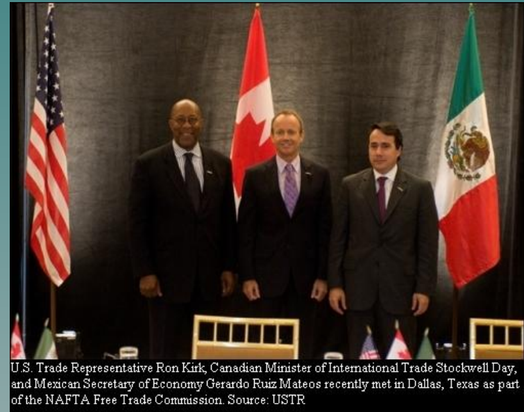
U.S. Trade Representative Ron Kirk, Canadian Minister of International Trade Stockwell Day, and Mexican Secretary of Economy Gerardo Ruiz Mateos recently met in Dallas, Texas as part of the NAFTA Free Trade Commission.