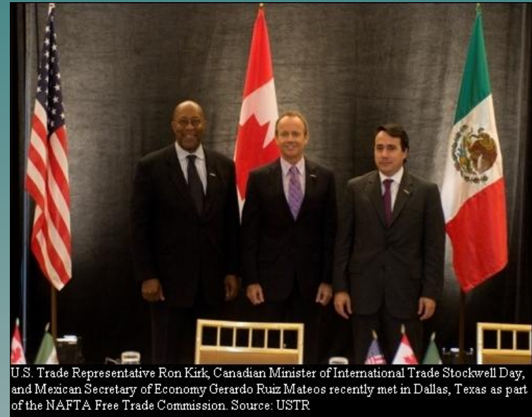
U.S. Trade Representative Ron Kirk, Canadian Minister of International Trade Stockwell Day, and Mexican Secretary of Economy Gerardo Ruiz Mateos recently met in Dallas, Texas as part of the NAFTA Free Trade Commission.