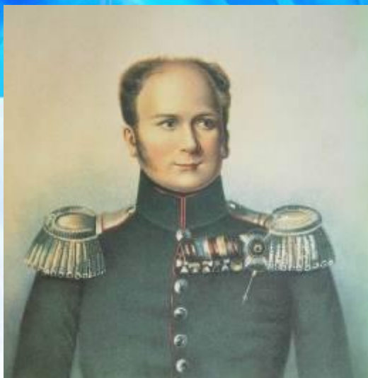
Александр I (император в 1801-1825гг.)