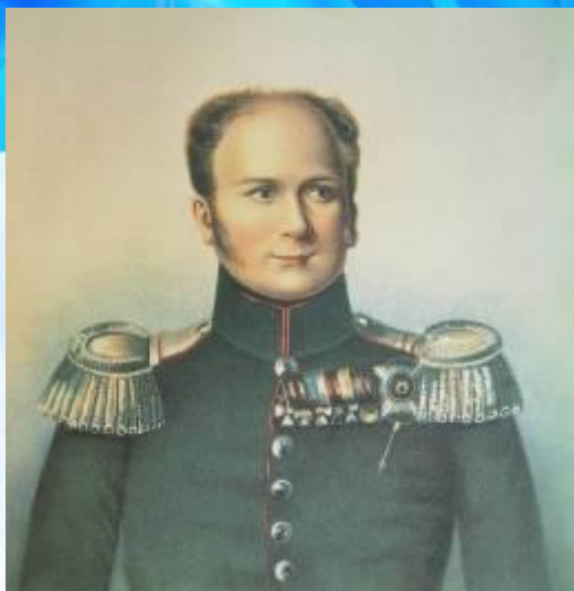
Александр I (император в 1801-1825гг.)