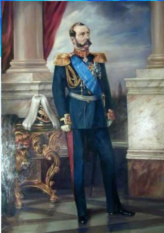
Александр II – император России 1825-1855гг.