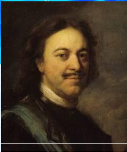
Петр Первый (1672-1725)