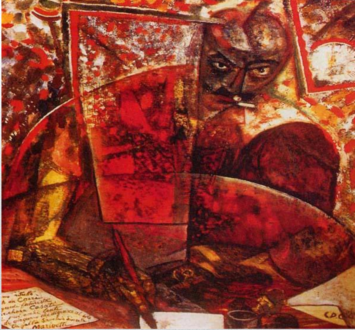
Портрет Маринетти (1910-1911)