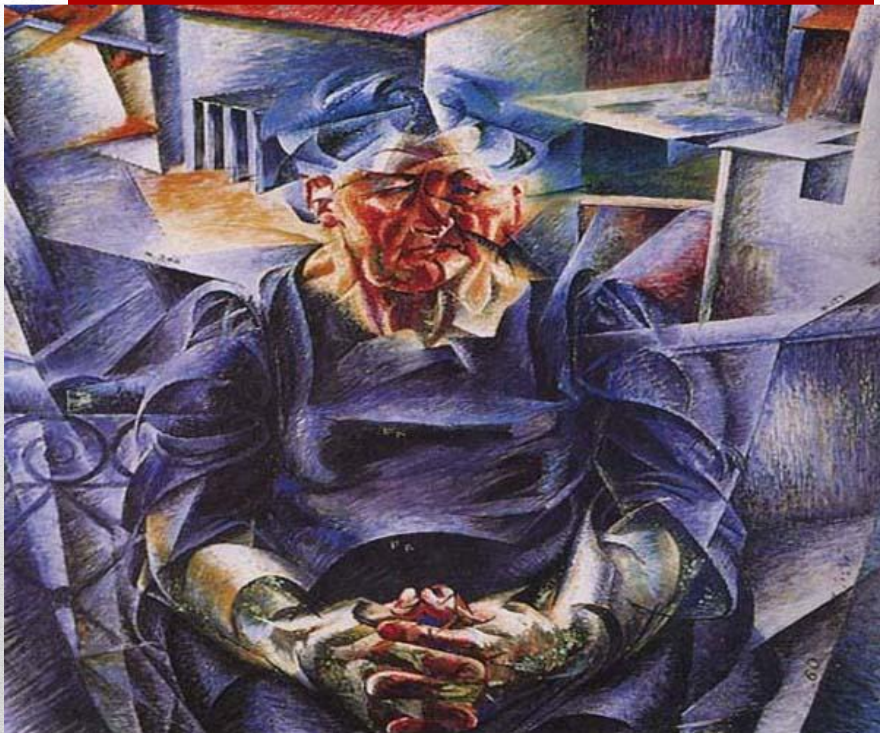
Горизонтальные ритмы (1912)