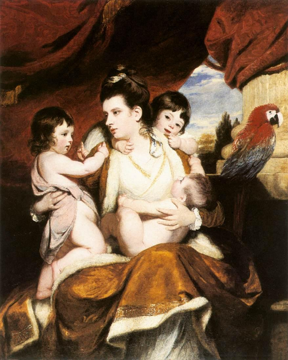
Рейнолдс. Леди Кокберн и трое ее старших сыновей. 1773