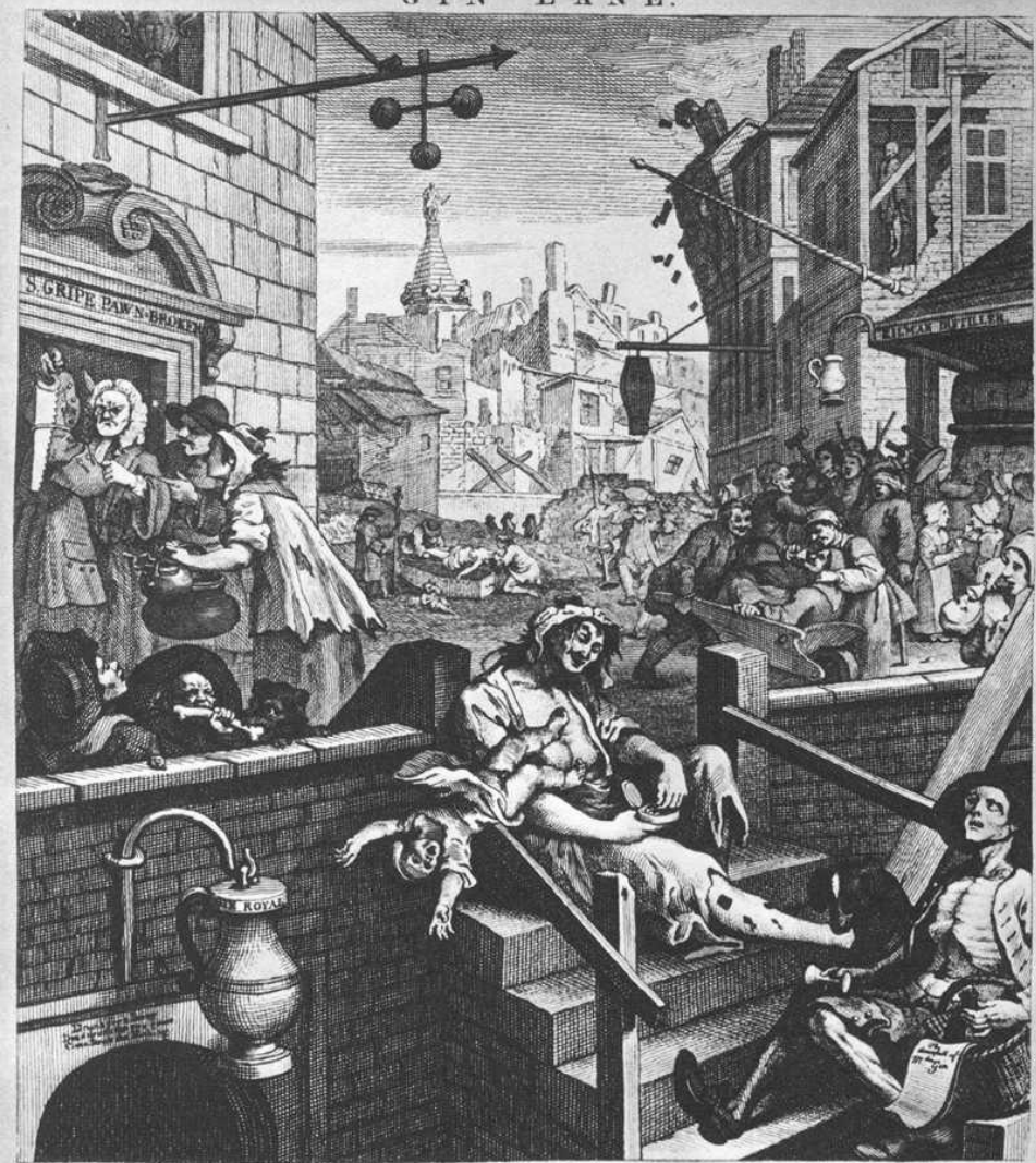
Хогарт Переулоч джина 1751