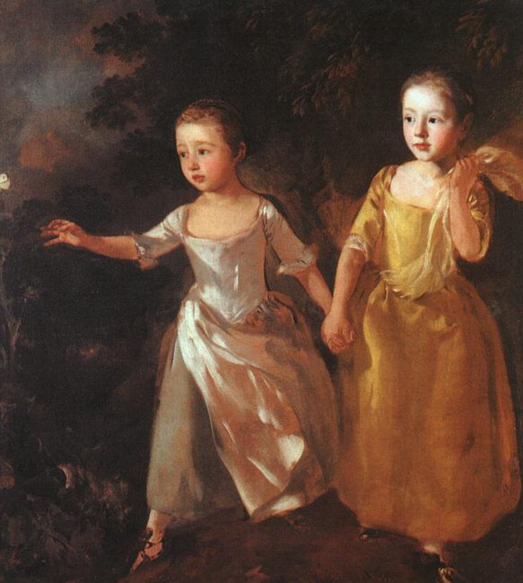
Томас Гейнсборо Дочери художника 1756