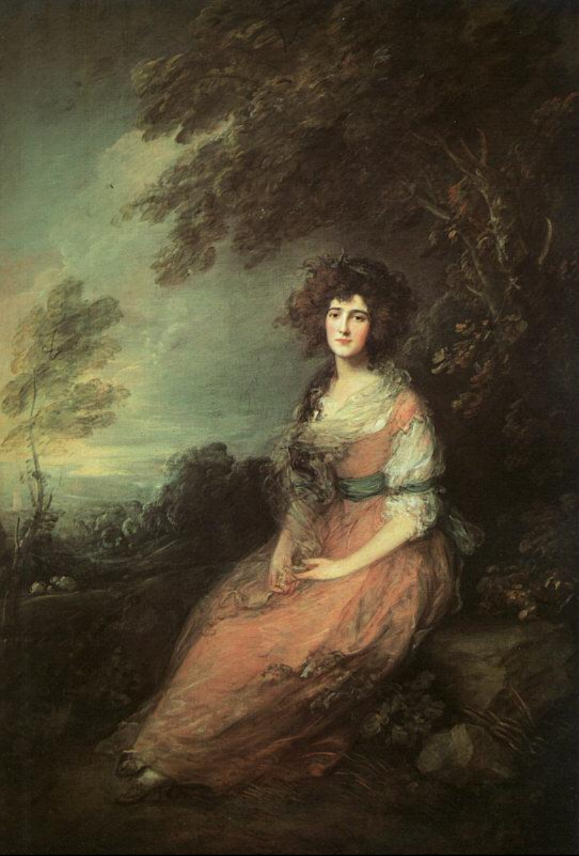
Гейнсборо Миссис Ричард Бринсли Шеридан. 1785-86