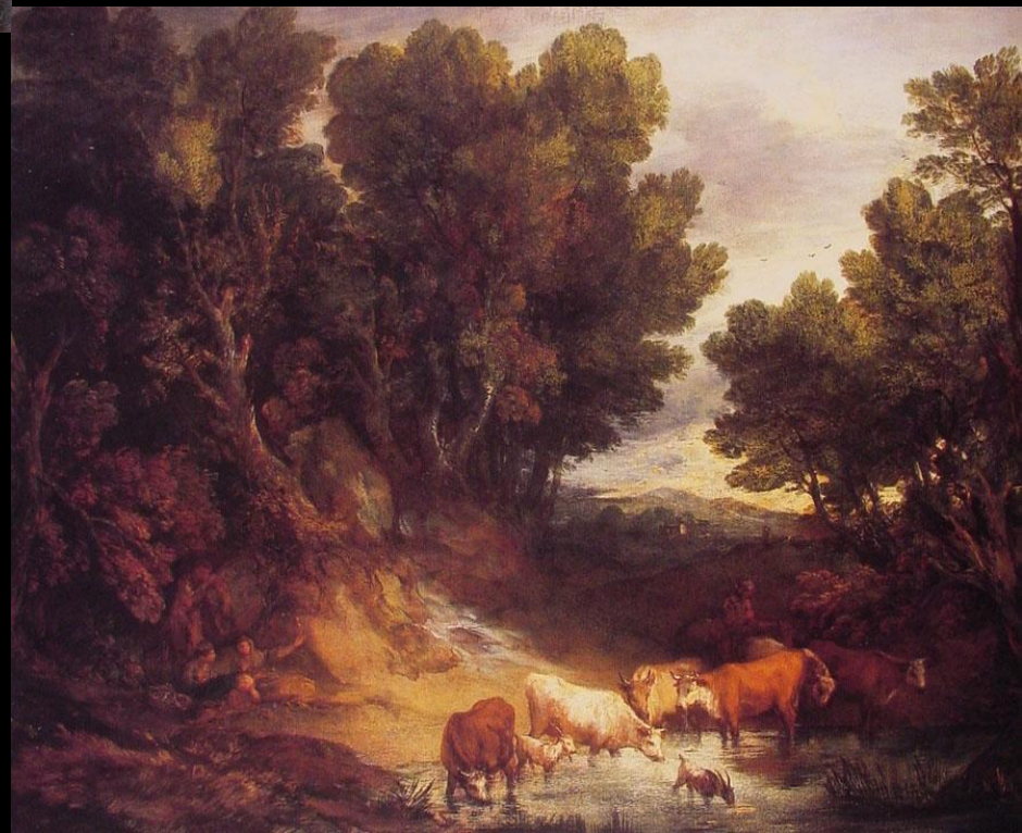
Гейнсборо Водопой 1777