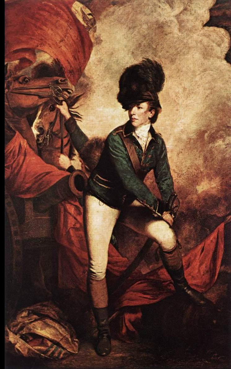
Рейнолдс. Полковник Тарлетон. 1782