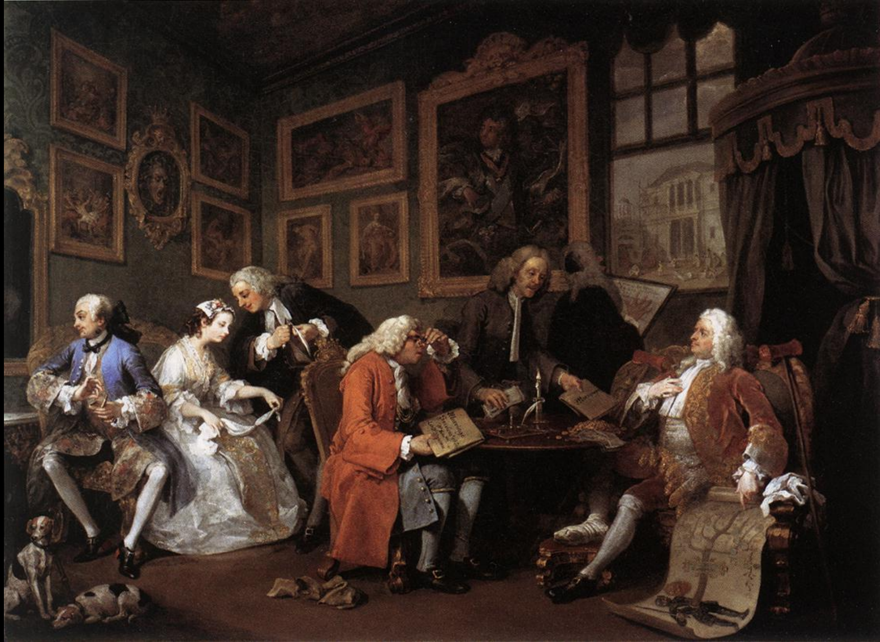
Уильям Хогарт Модный брак Сцена I. 1743-45