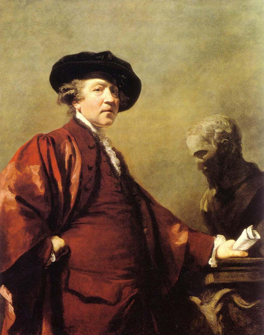
Автопортрет в костюме оксфордского профессора 1773