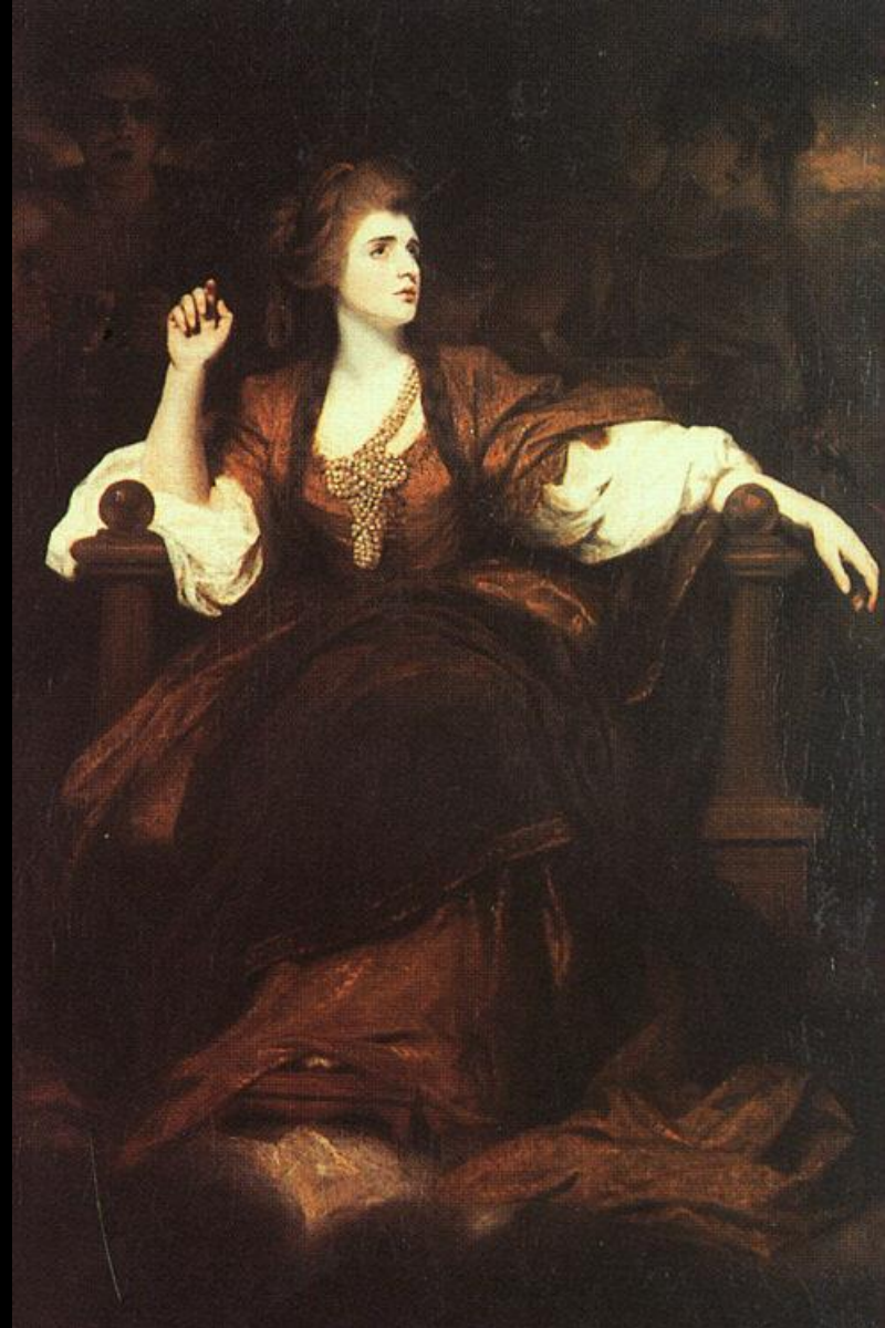
Рейнолдс Сара Сиддонс как муза трагедии