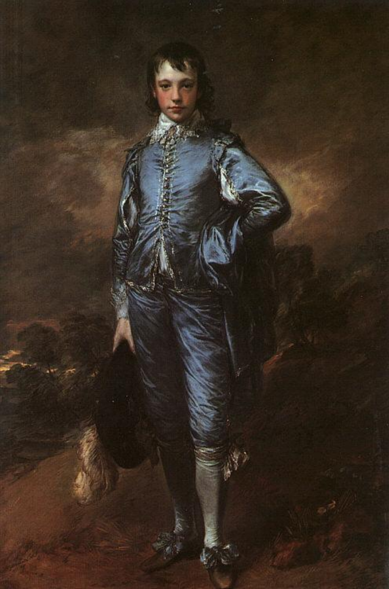
Гейнсборо Джонатан Баттл (Мальчик в голубом). Ок. 1770