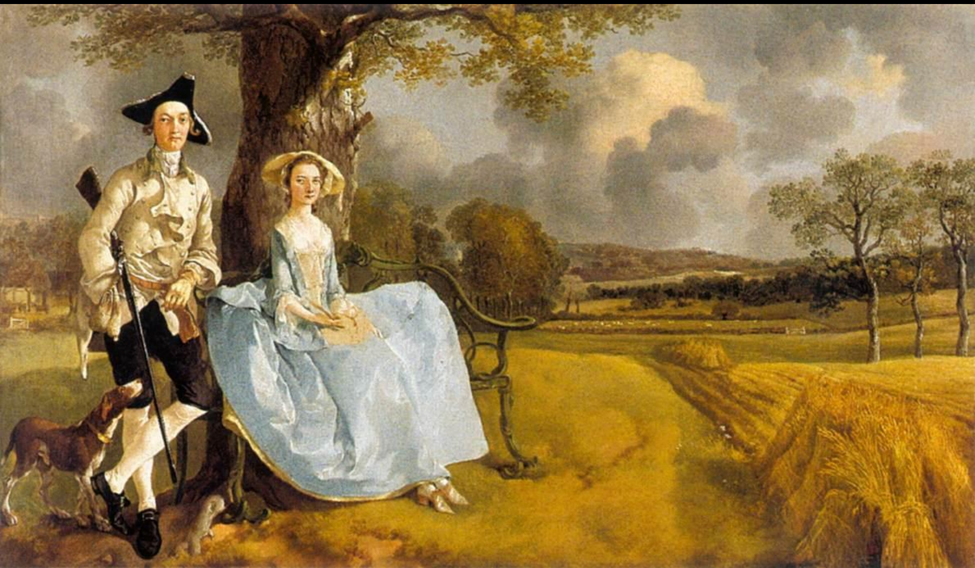
Гейнсборо. Роберт и Фрэнсис Эндрюс. 1748-49