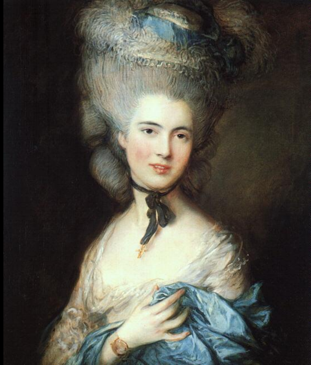
Гейнсборо Дама в голубом 1777-79