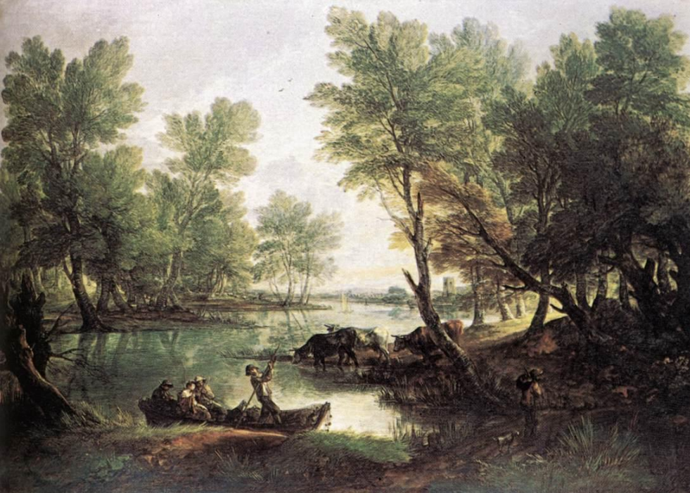
Гейнсборо Речной пейзаж 1768-70