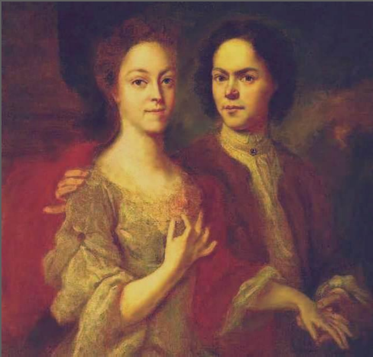
Матвеев, А. Автопортрет с женой. 1729. Русский музей. С.-Петербург.