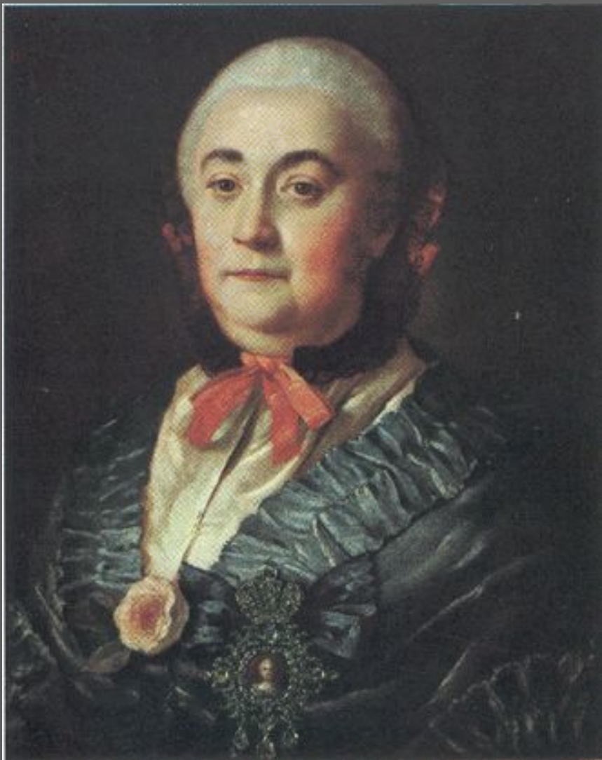
Портрет графини М. Румянцевой 1764. Русский музей, С.-Петербург.