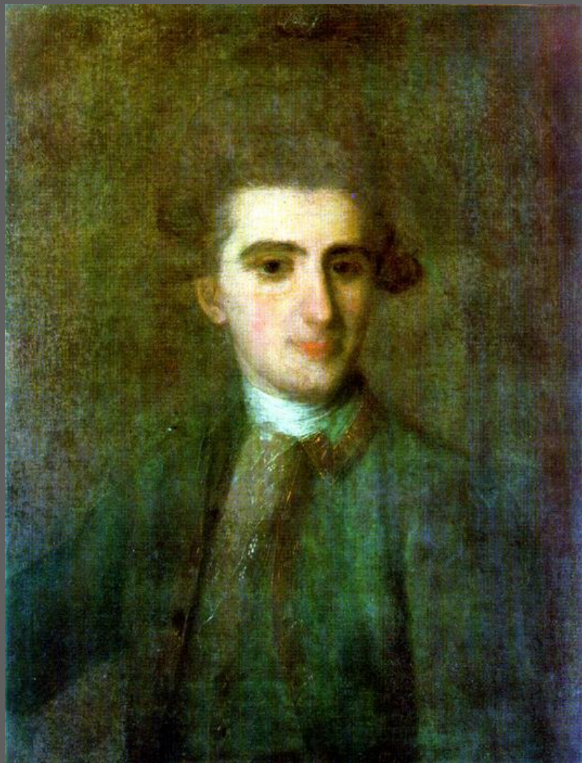
Портрет Н.Е. Струйского. 1772. ГТГ, Москва.