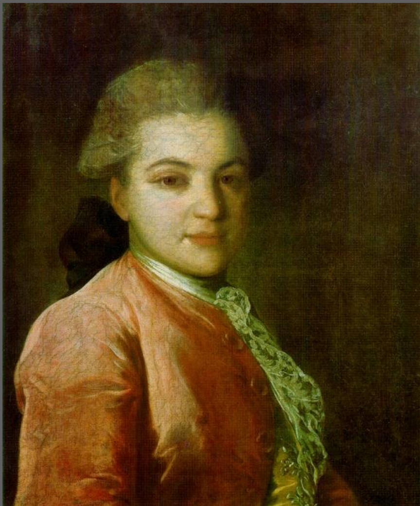
Рокотов Ф.С. Портрет И.И. Воронцова. 1765. Третьяковская галерея, Москва.