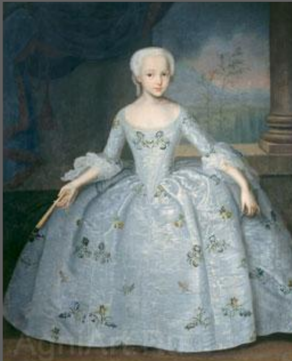
Портрет Сарры-Элеоноры Фермор. 1750. Русский музей, С.-Петербург.