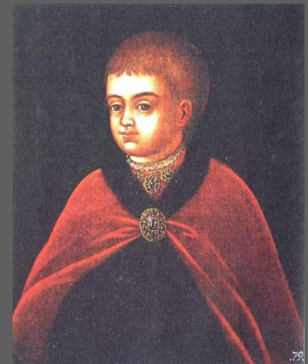
Парсуна Царь Пётр I в детстве.