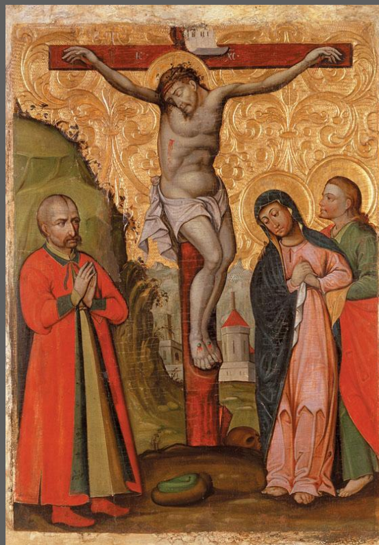
Распятие с портретом казака Леонтия Свечки. Кон. XVII в. Полтавская обл., Национальный художественный музей, Киев.