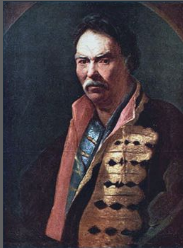
Никитин И.Н. Портрет Напольного гетмана. 20-е гг. XVIII в.