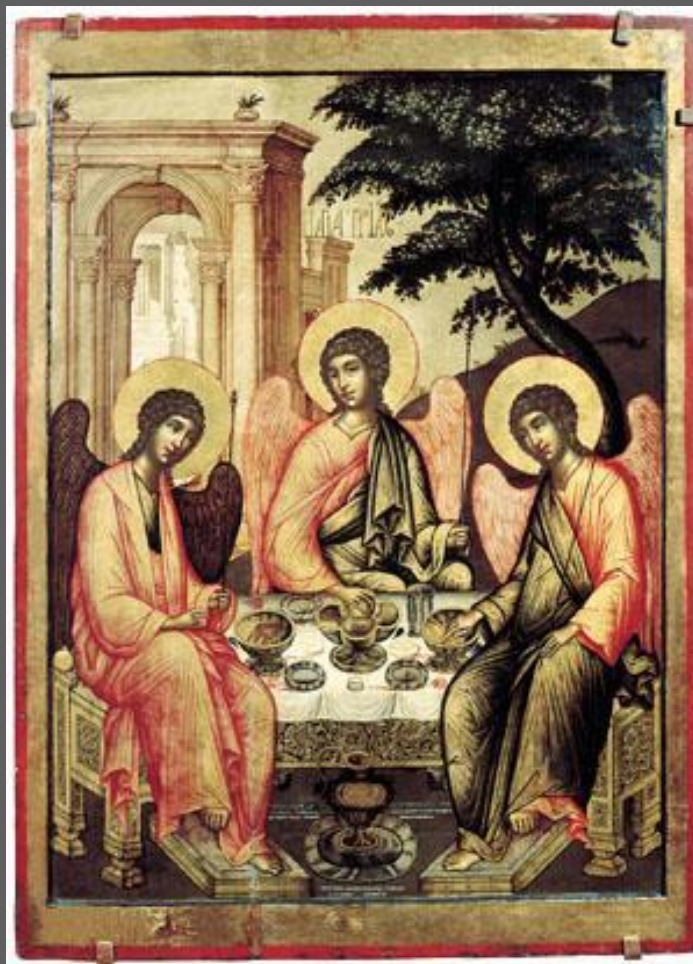
Симон Ушаков. Троица Ветхозаветная. 1671. ГРМ