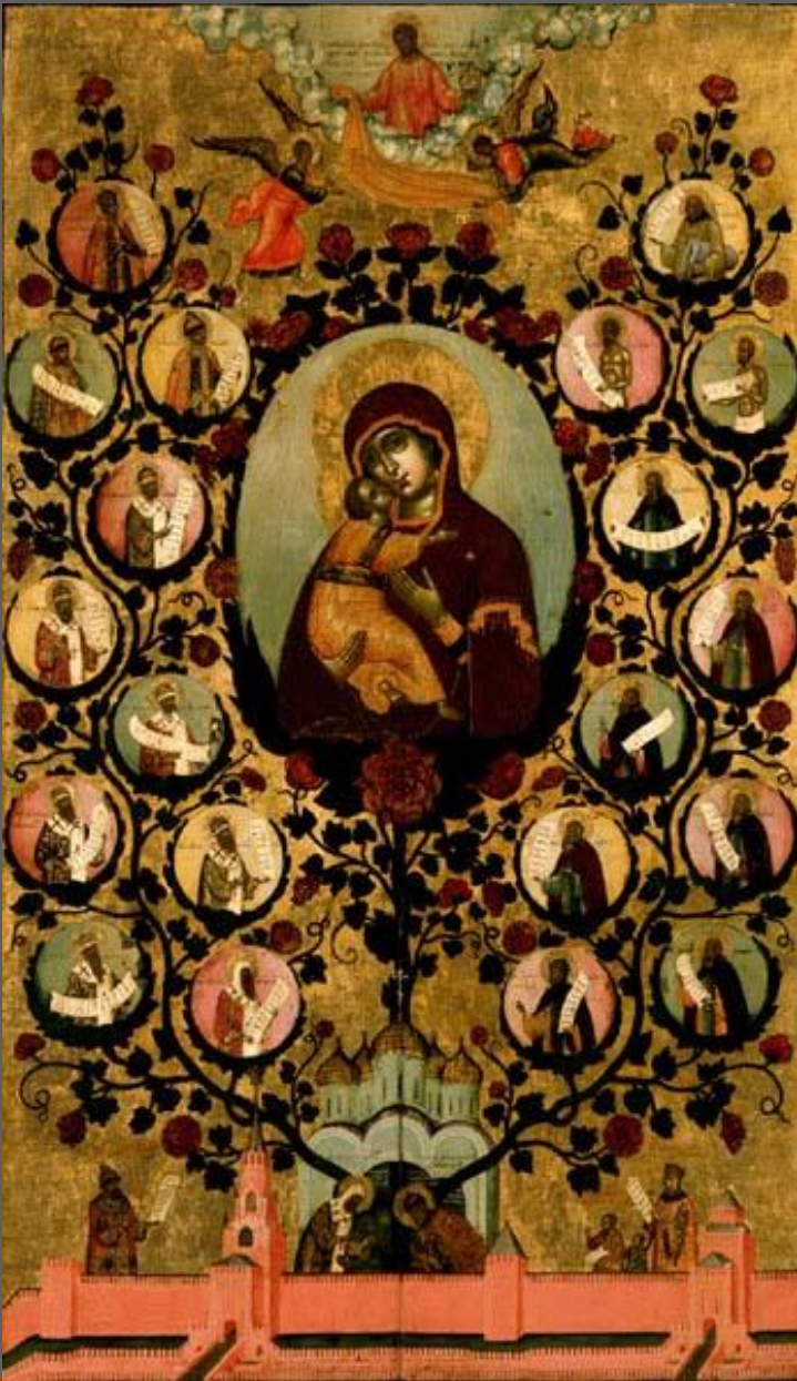
Симон Ушаков. Древо государства Московского. Москва. 1668. Дерево, темпера.