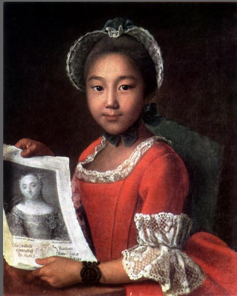
И.П. Аргунов. Портрет калмычки Аннушки, 1767