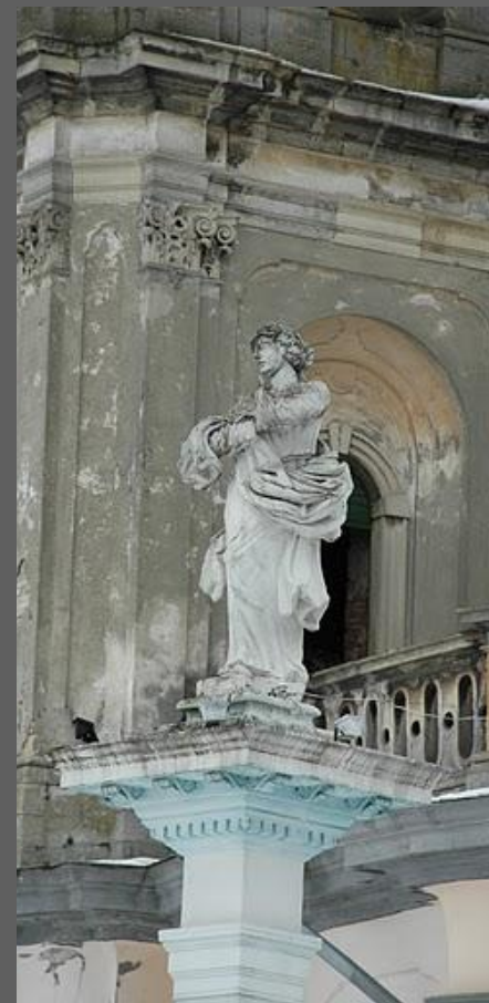
И.Г. Пинзель. Колона со статуей Девы Марии. Городенц