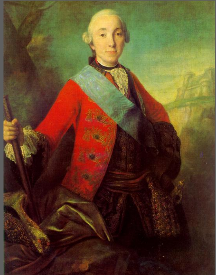
Портрет вел. кн. Петра Федоровича. 1758. Русский музей, С.-Петербург, повторение — в Третьяковской галерее, Москва.