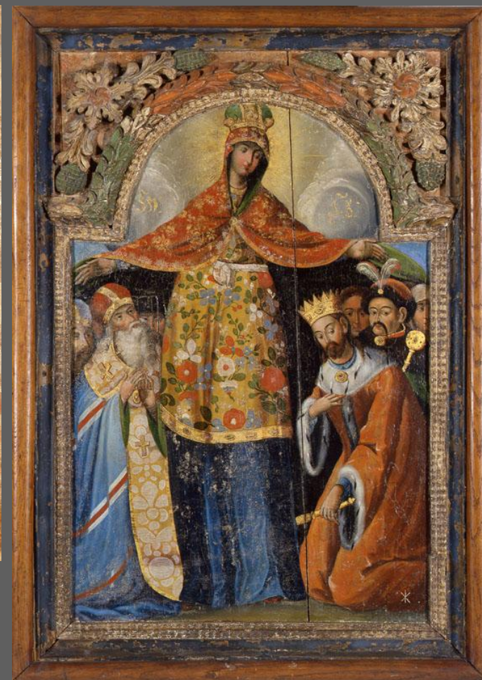
Покрова с портретом гетмана Богдана Хмельницкого. XVIII в. Киевская обл., Национальный художественный музей, Киев.