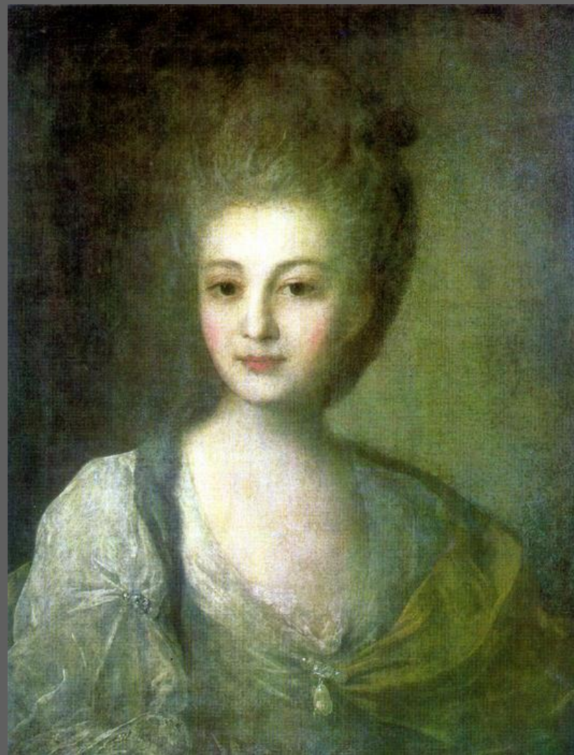
Портрет А.П. Струйской. 1772. ГТГ, Москва.