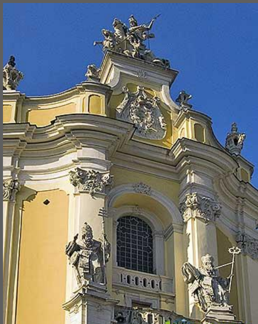
Собор Св. Юра, Львов. И.Г. Пинзель. Статуя Юрия Змееборца. Святые Лев та Атаназий.