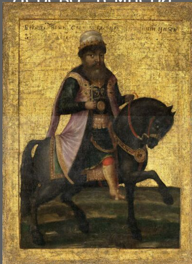
Царь Михаил Фёдорович Романов. Парсуна. XVII век. Оружейная палата, Москва.