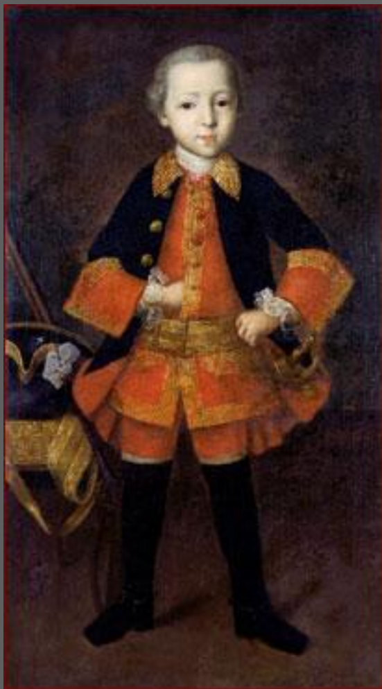
Князь Ф. Голицин в детстве (фрагмент). 1760. Третьяковская галерея. Москва.