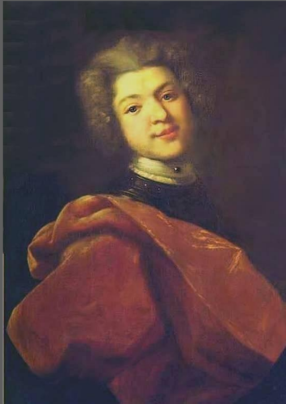
Иван Никитин. Портрет барона С. Строганова. 1726.