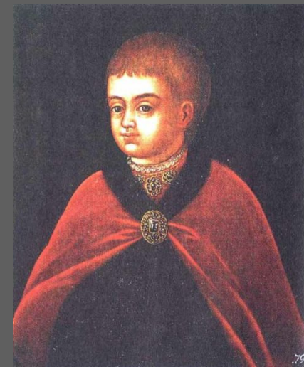
Парсуна Царь Пётр I в детстве.