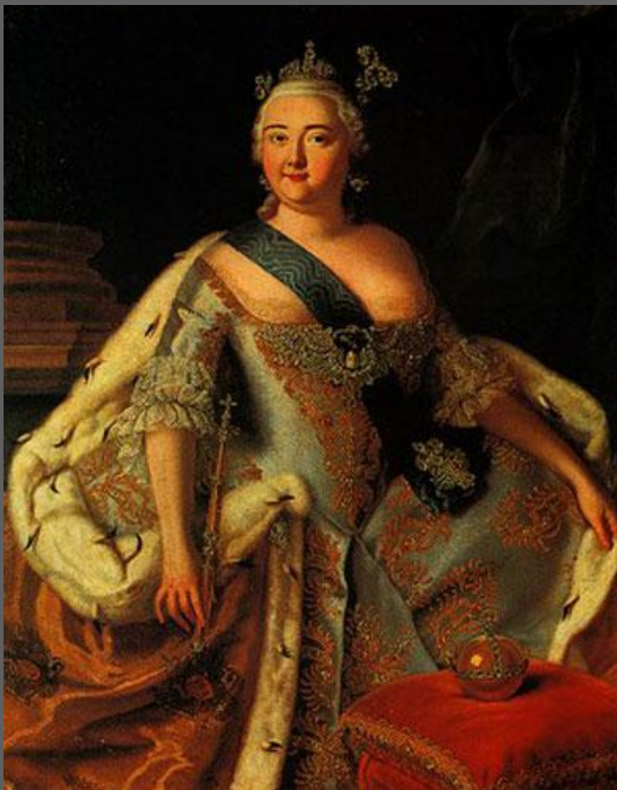
А. Антропов. Портрет императрицы Елизаветы Петровны. 1753—1755.