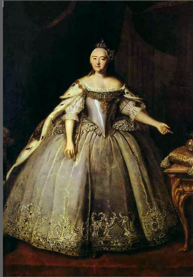
И. ВИШНЯКОВ. Императрица Елизавета Петровна. 1743. Третьяковская галерея, Москва.