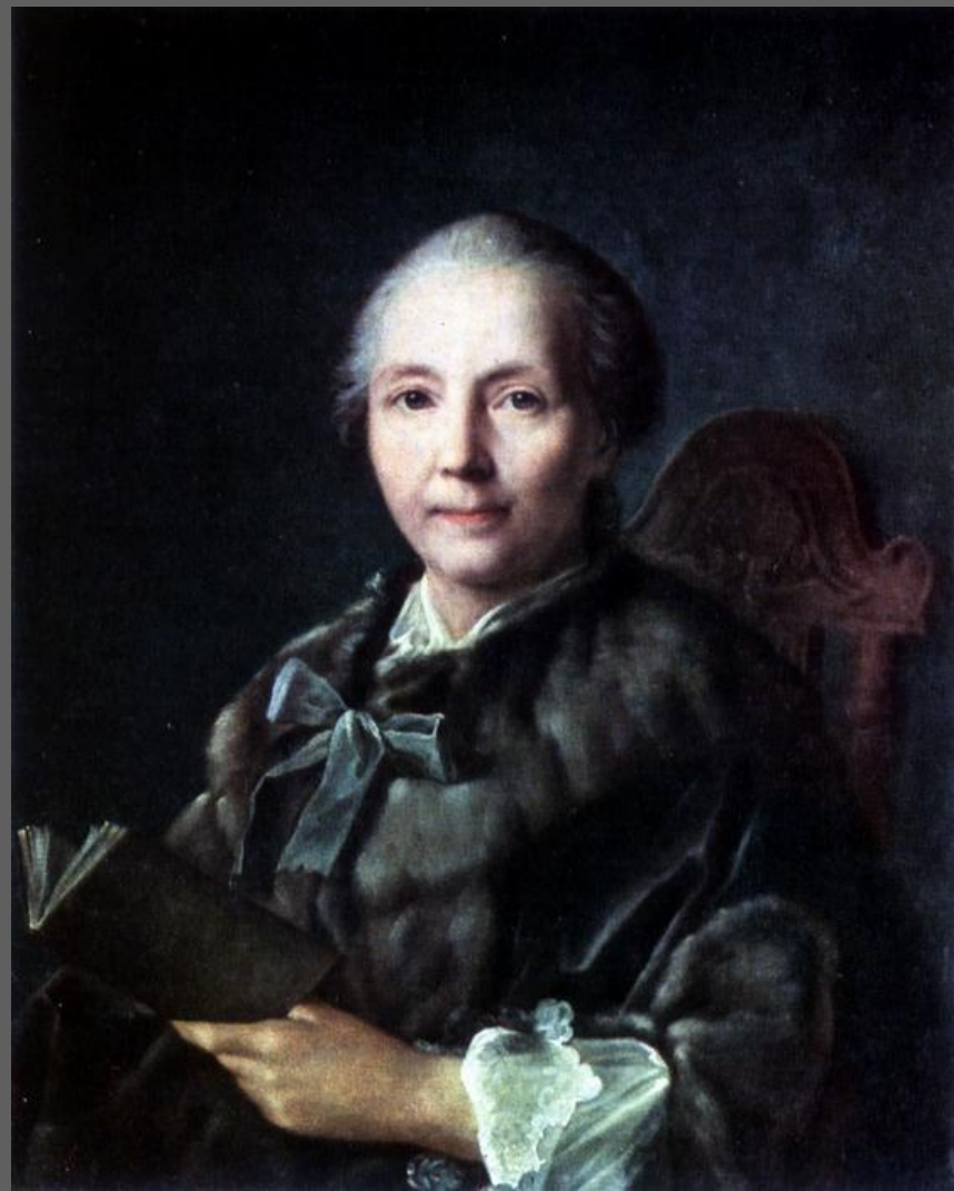
Портрет Хрипуновой. 1757. Останкинский дворец-музей, Москва.