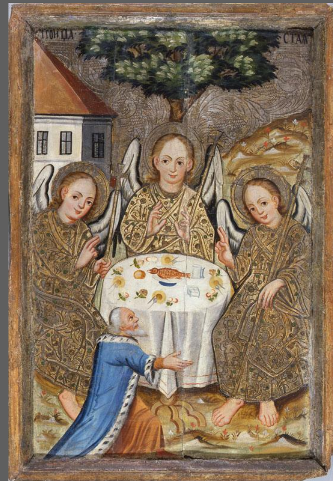
Троица. 1730-1750-е, Национальный художественный музей, Киев.