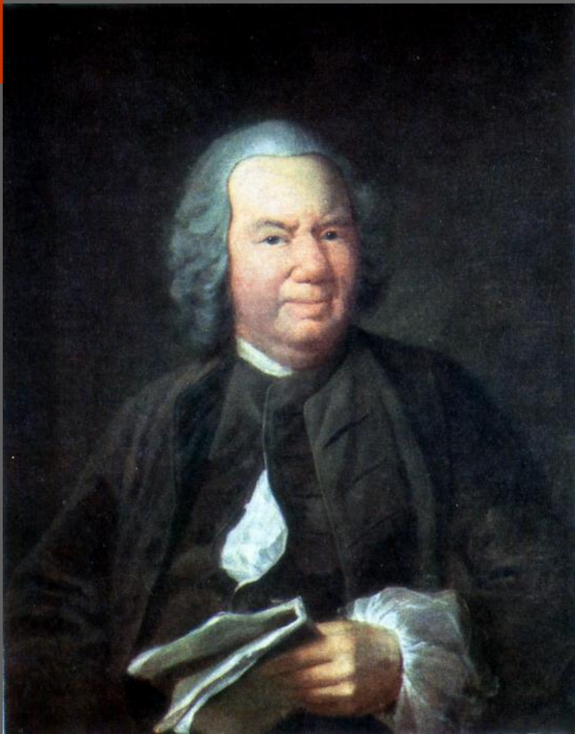
Портрет К.А.Хрипунова. 1757. Останкинский дворец-музей, Москва.