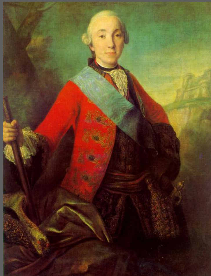
Портрет вел. кн. Петра Федоровича. 1758. Русский музей, С.-Петербург, повторение — в Третьяковской галерее, Москва.