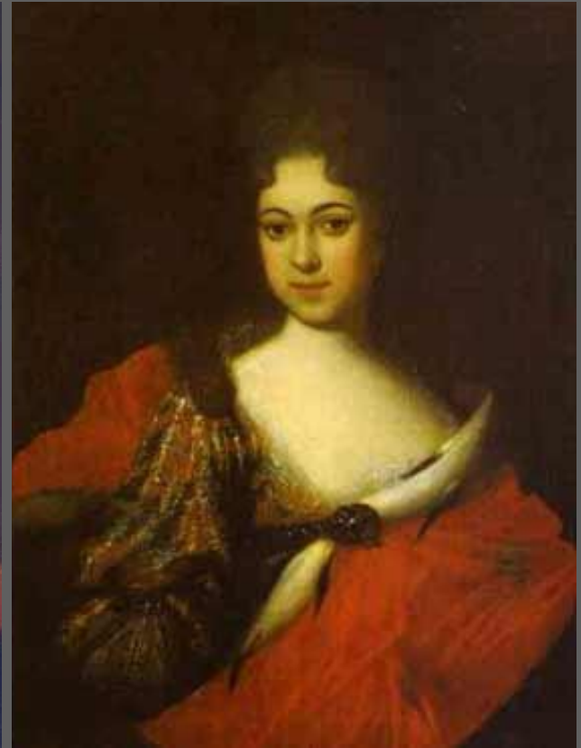
Иван Никитин. Портрет царевны Прасковьи Ивановны. 1714.