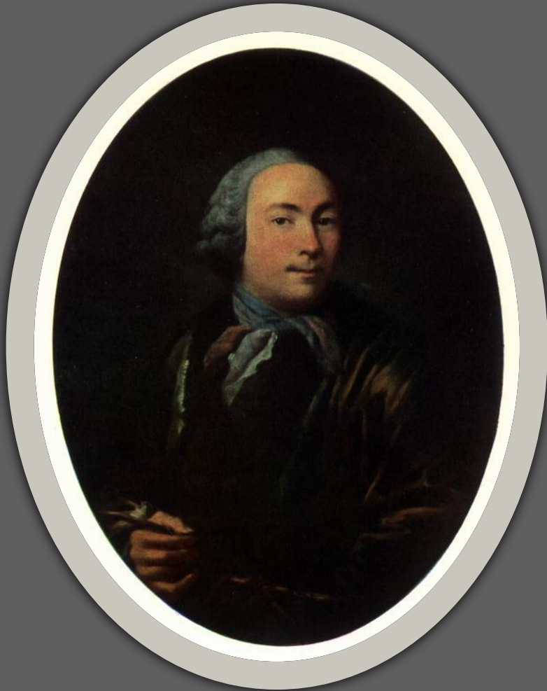
И.П. Аргунов. Автопортрет