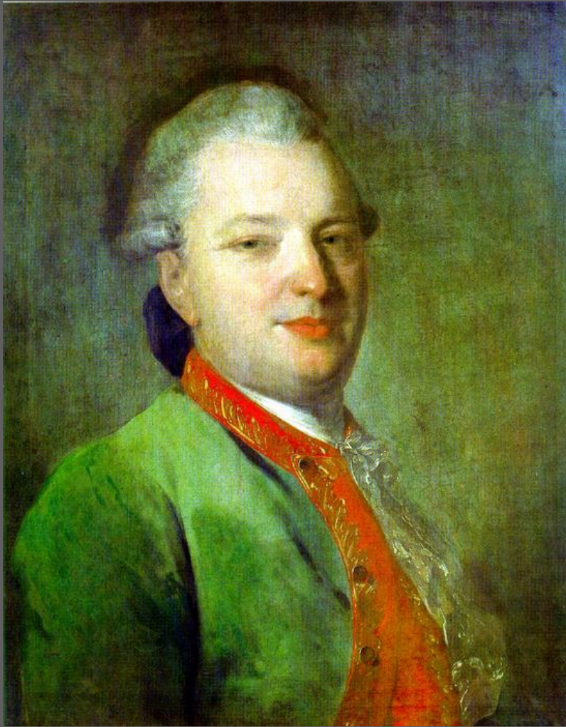
Портрет поэта В.И. Майкова. ок. 1765. Третьяковская галерея, Москва.