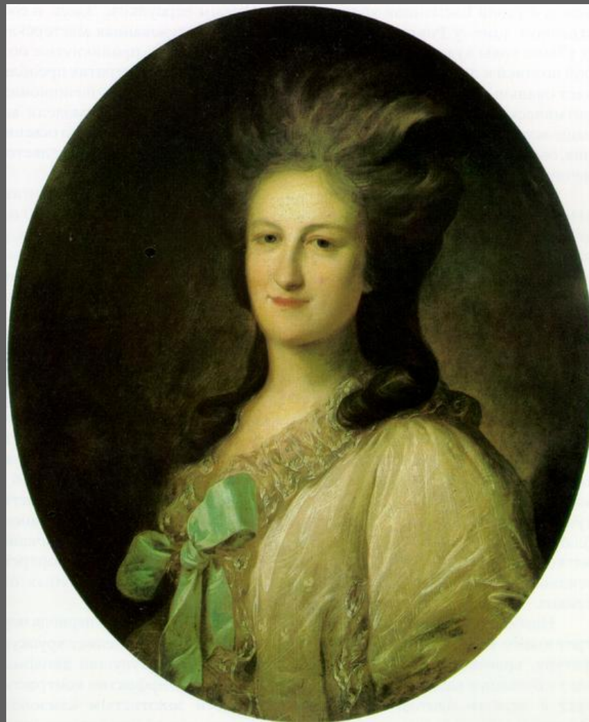
Ф.С. Рокотов Портрет В.Е. Новосильцовой. 1780. Третьяковская галерея, Москва.