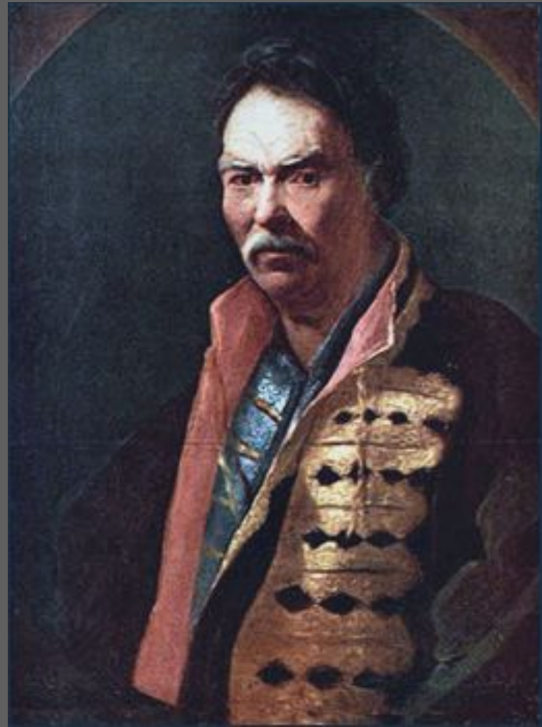
Никитин И.Н. Портрет Напольного гетмана. 20-е гг. XVIII в.