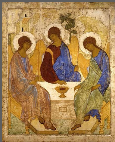
Андрей Рублев. Троица. ГТГ.