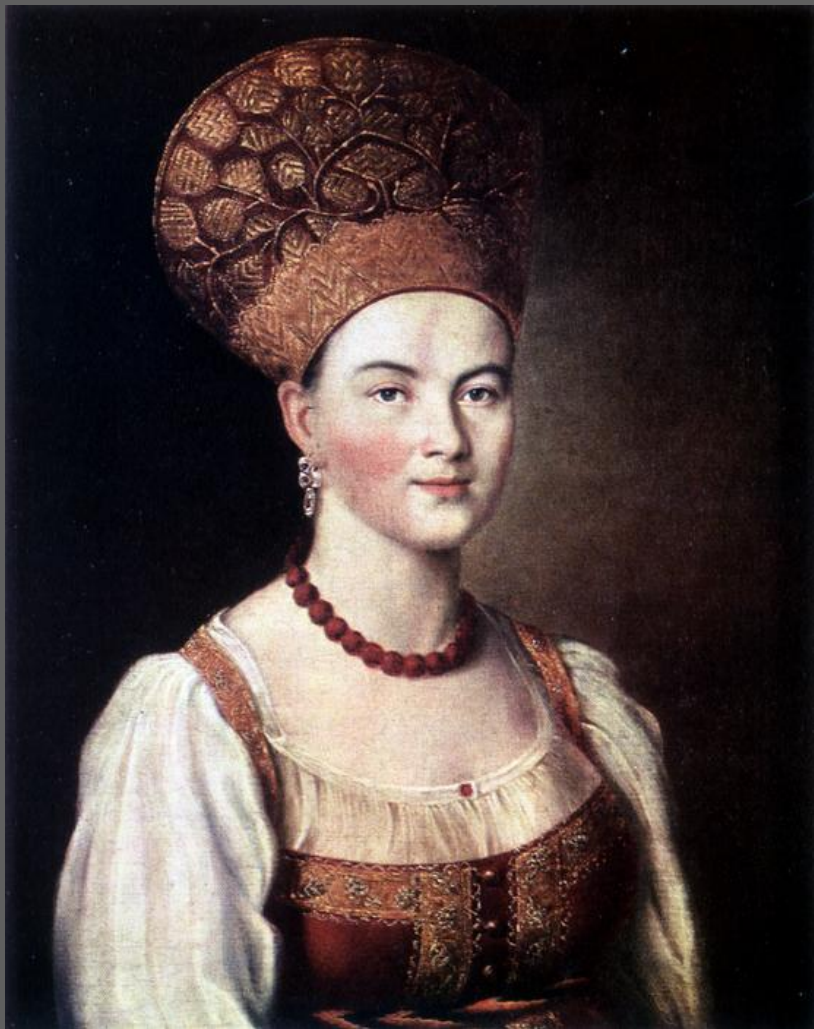
И.П. Аргунов. Портрет неизвестной крестьянки в русском костюме, 1770 — 80-е гг.