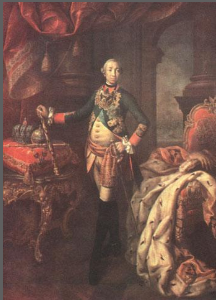
А. Антропов. Портрет императора Петра III. 1762. Русский музей, С.-Петербург.