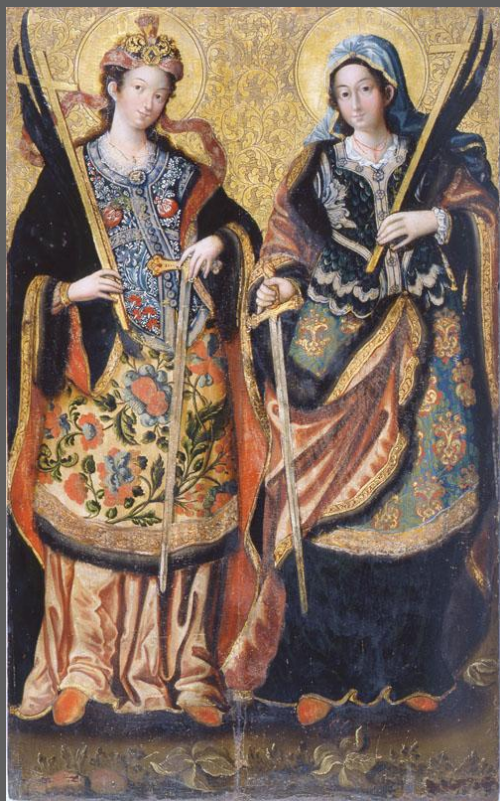
Св.Анастасия и Уляния. 1740-е гг. Северное Левобережье. Национальный художественный музей, Киев.