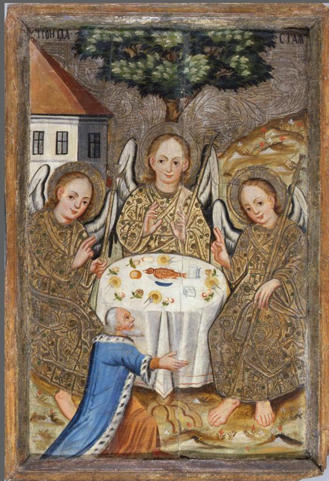
Троица. 1730-1750-е, Национальный художественный музей, Киев.