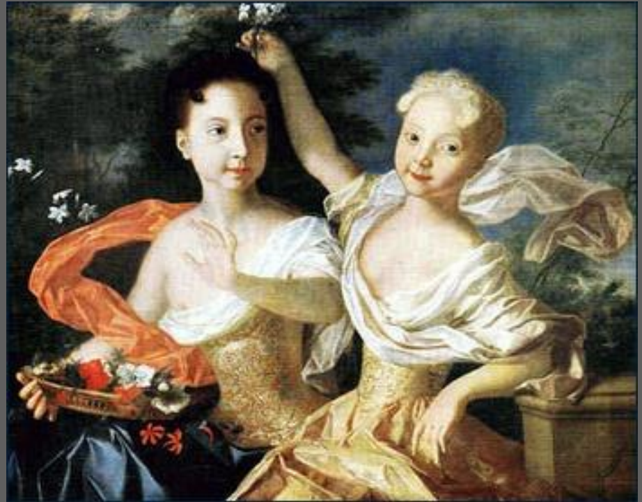
Каравакк, Луи, 1684—1754. Портрет царевен - Анны Петровны и Елизаветы Петровны. 1717, Русский музей, С. Петербург.