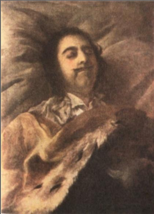
Никитин И.Н. Петр на смертном одре. 1725.