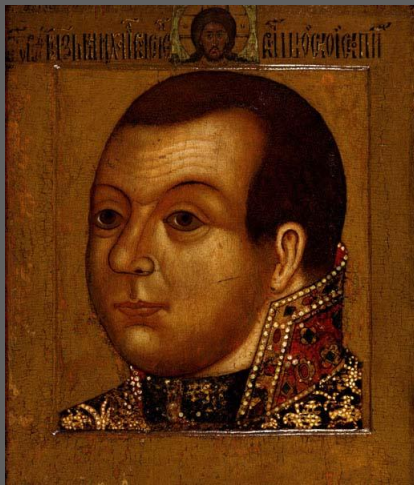
Парсуна князя М.В. Скопина-Шуйского. Москва. Ок. 1630 Дерево, темпера