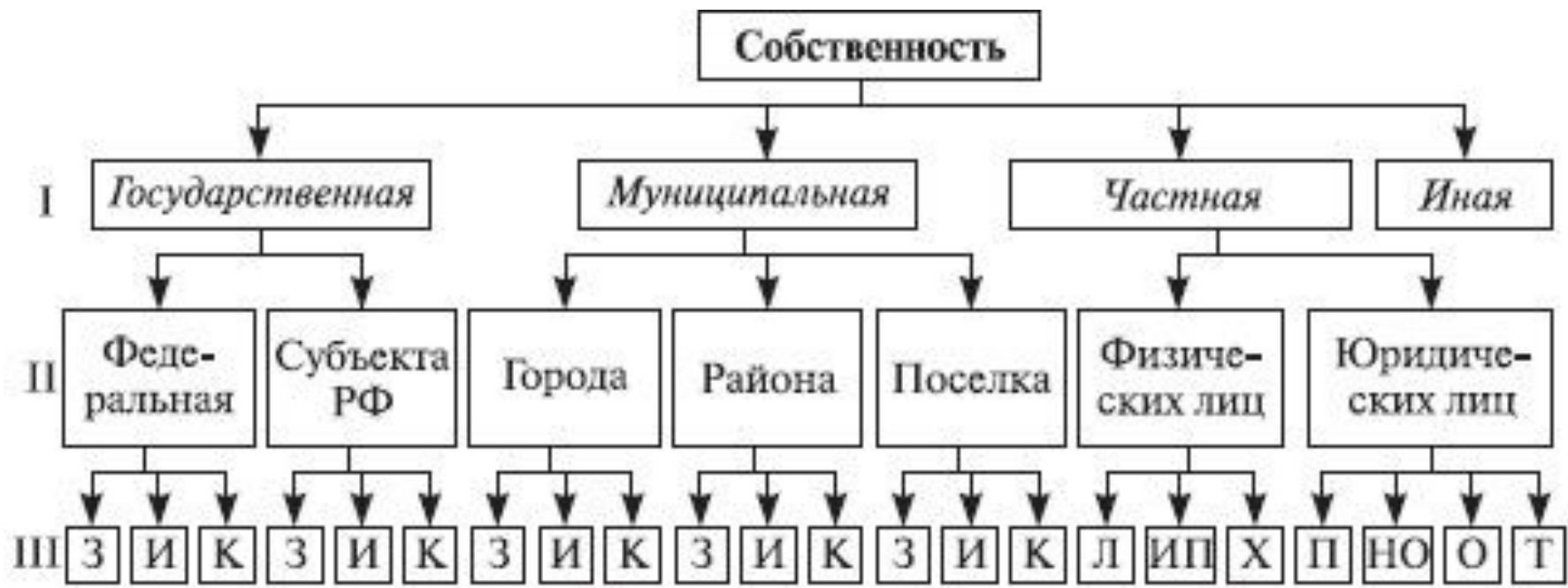
Рис. Структура собственности как объекта управления: З – земля и другие природные ресурсы; И – имущество унитарных предприятий и учреждений, пай и доли; К – казна (бюджет и все остальное); Л – личная собственность; ИП – индивидуальное предпринимательство; Х – хозяйство без образования юридического лица; П – производственные кооперативы; НО – некоммерческие организации; О – общества; Т – товарищества.

Гражданский кодекс РФ позволяет выстроить систему объектов управления собственностью, приведенную на рисунке: