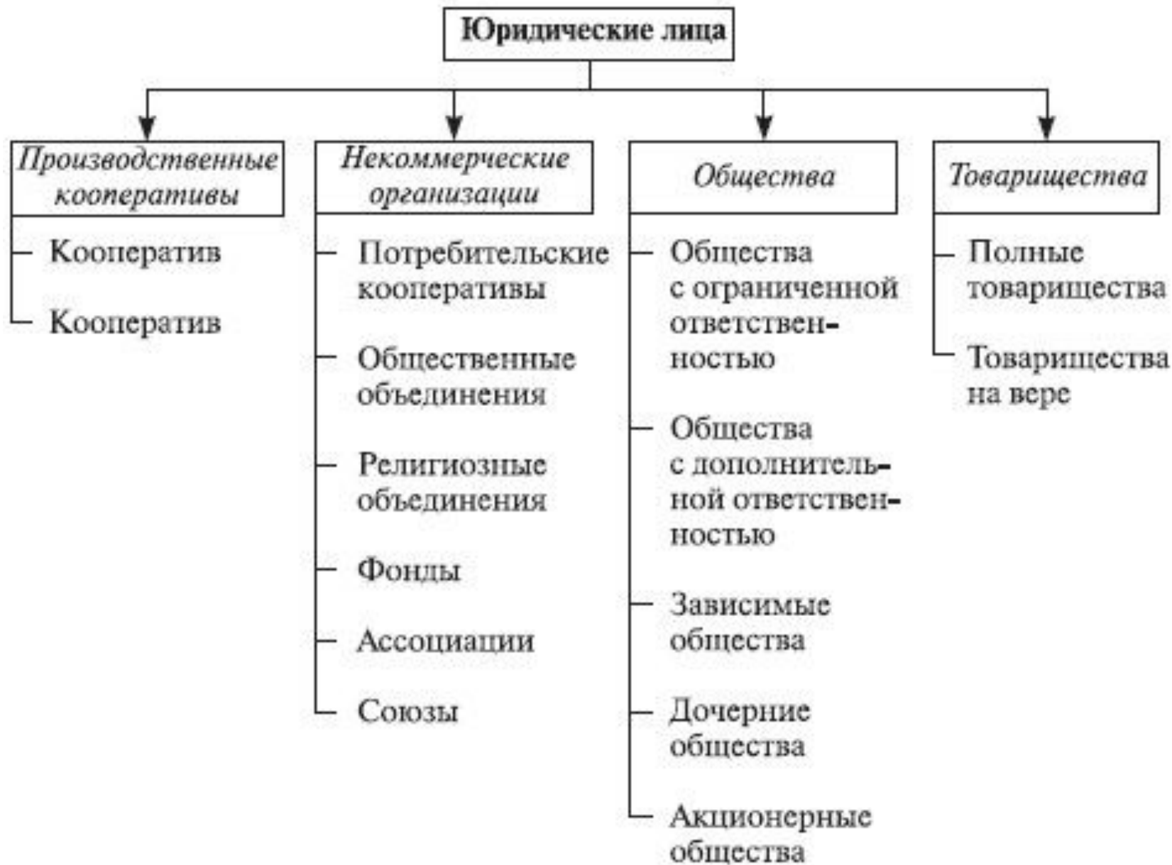
Рис. Структура объектов собственности юридических лиц