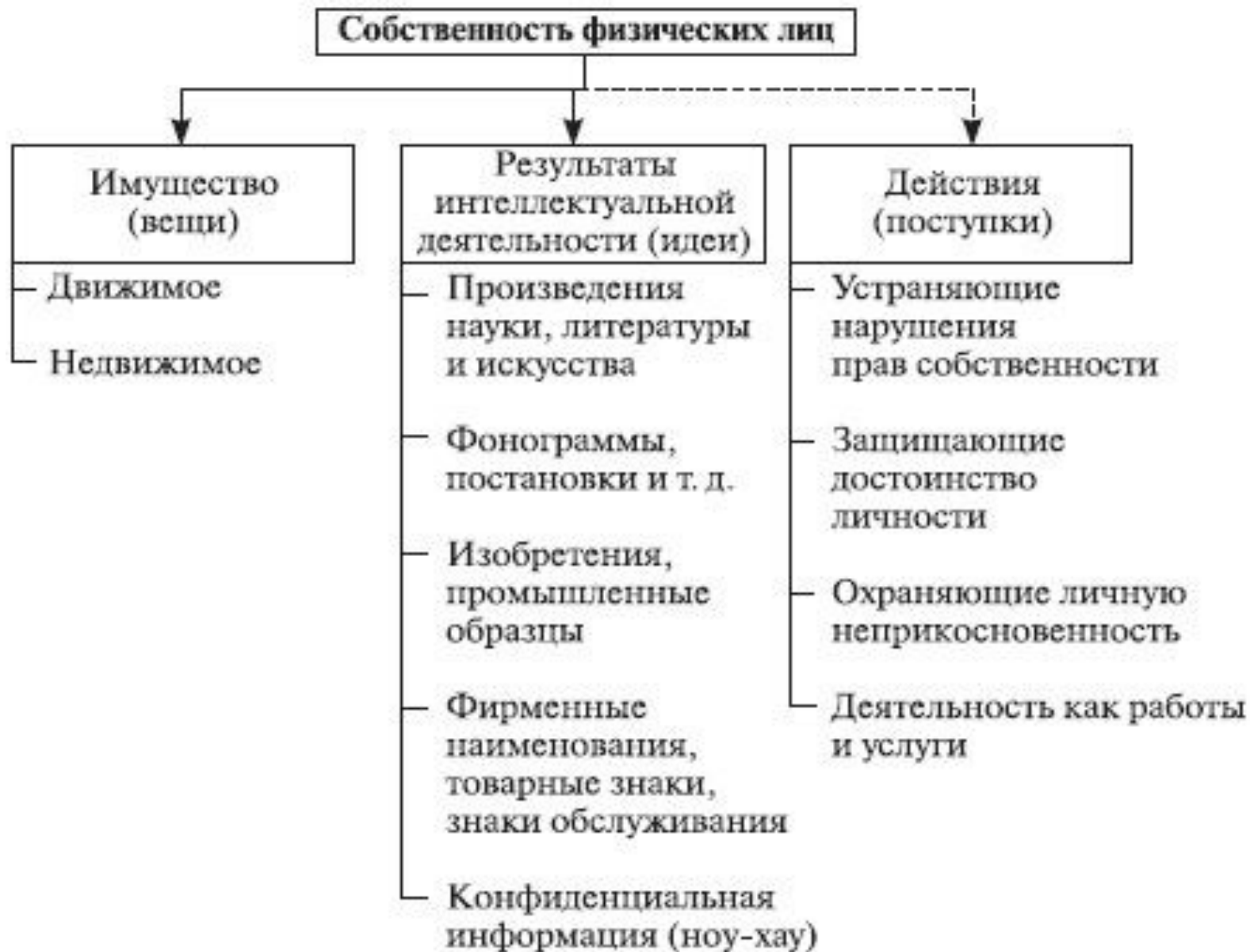
Рис. Структура объектов собственности физических лиц