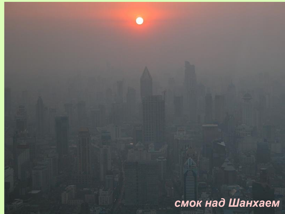
смок над Шанхаем