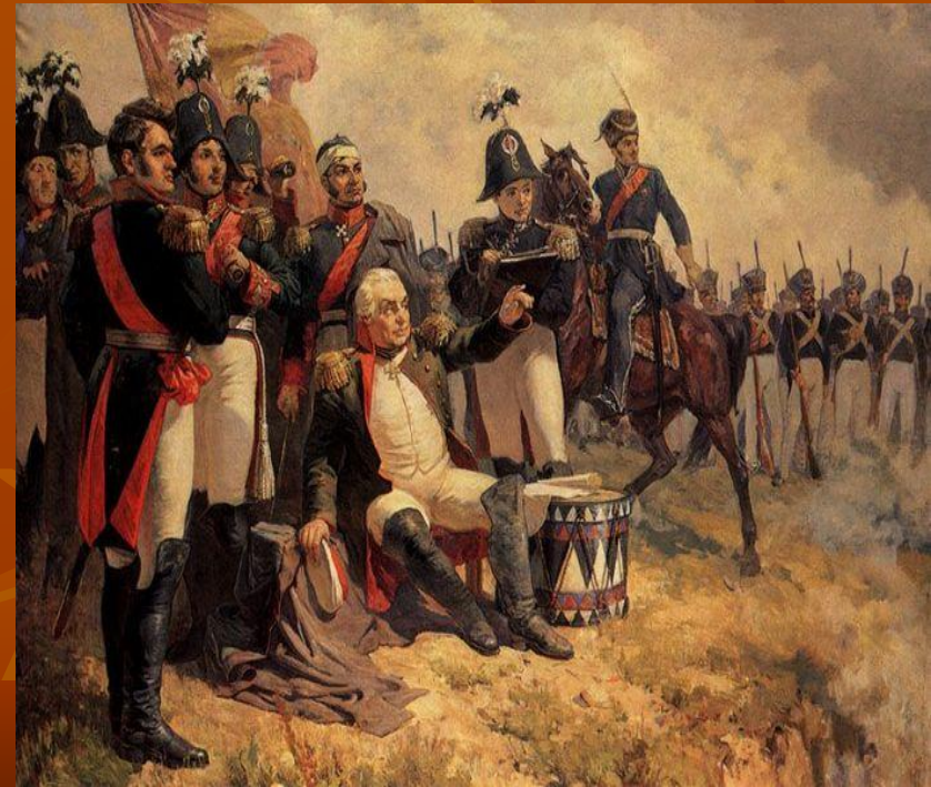
Кутузов в битве при Бородино