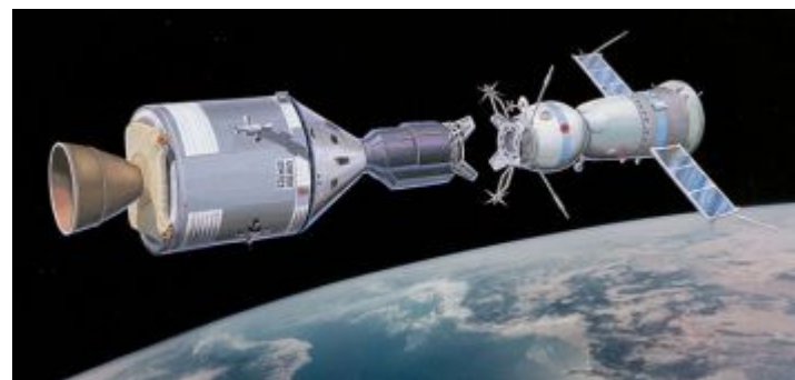
Союз-Аполлон (художественная реконструкция)

Экипажи - Томас Стаффорд, Вэнс Бранд и Дональд Слейтон (Аполлон), Алексей Леонов и Валерий Кубасов (Союз-19).