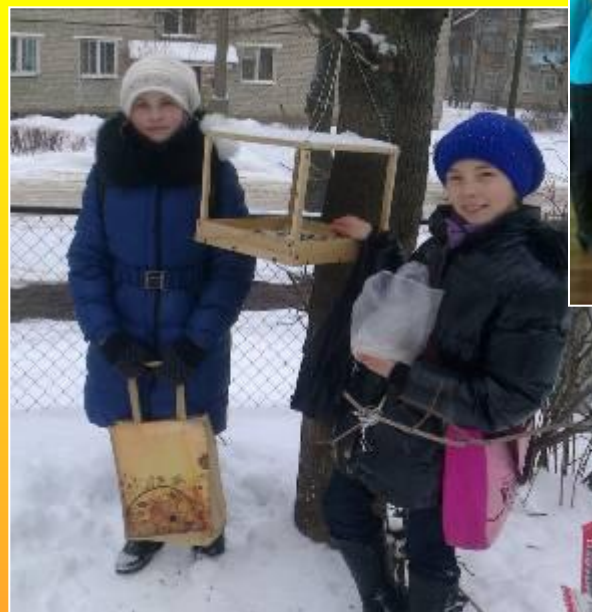
Акция «Птичья столовая»