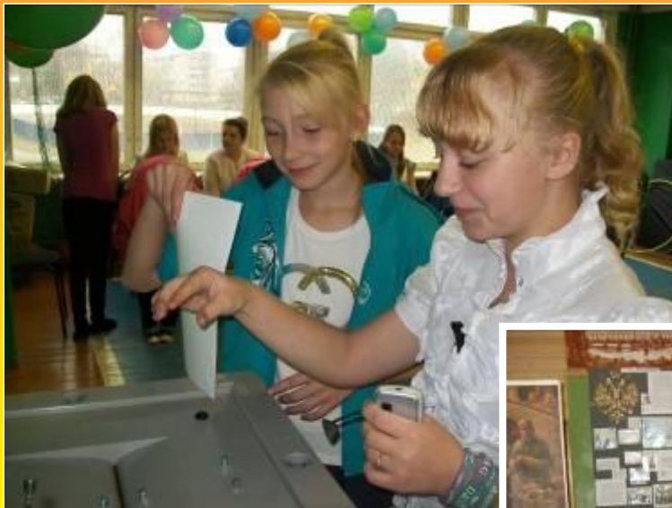
Деловая игра «Я избиратель»