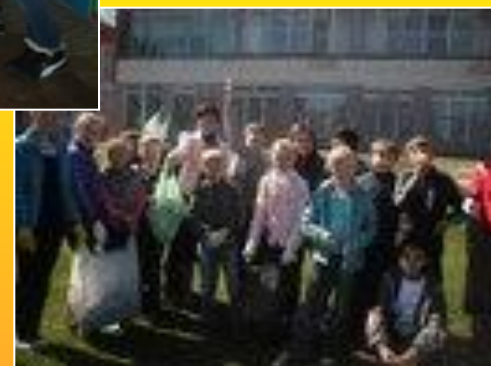
Субботник у 5а класса