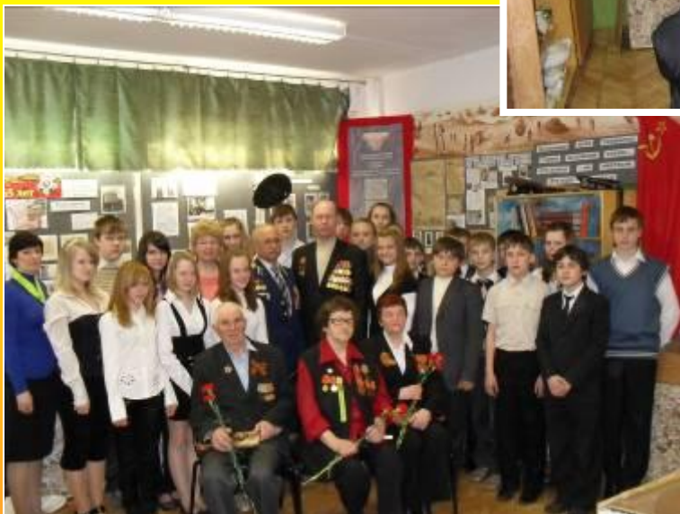
Встреча с ветеранами ВОВ и Афганистана