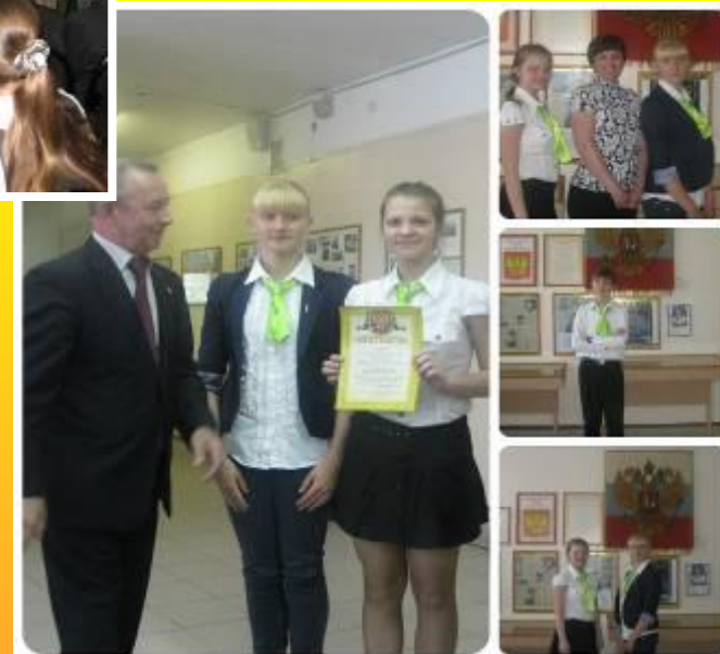
Областной конкурс «Мой музей»