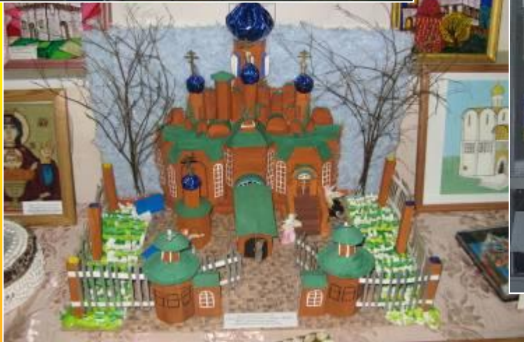
Поделки для Рождественских чтений