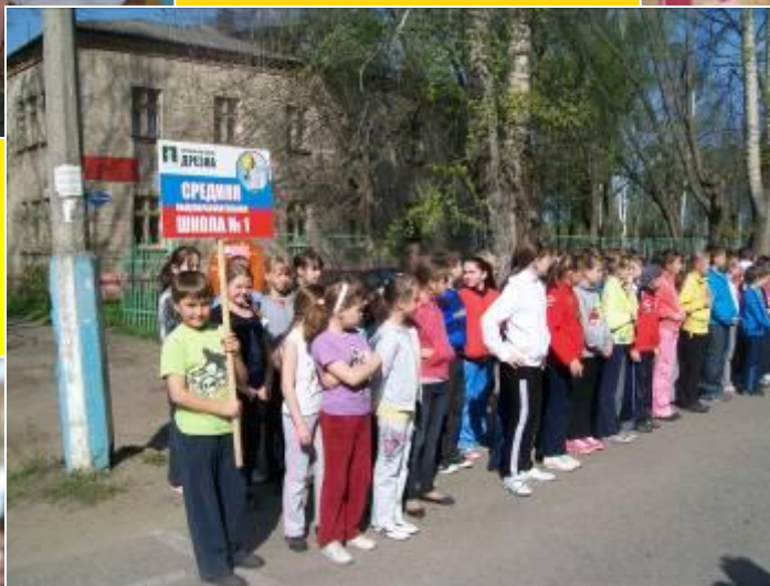
Пробег ко Дню Победы