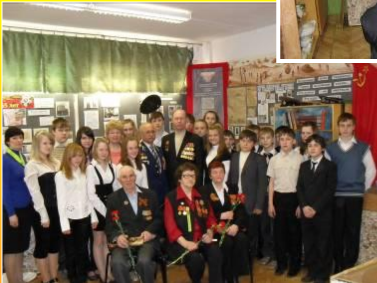
Встреча с ветеранами ВОВ и Афганистана