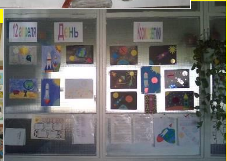
Выставка ко Дню космонавтики