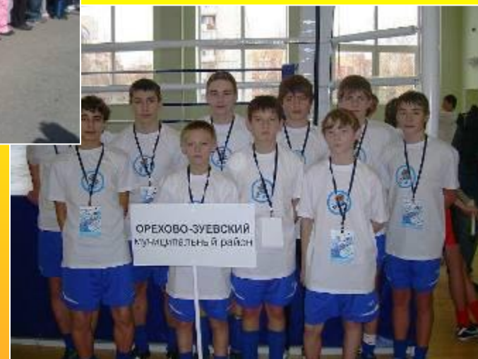
Образцовая футбольная команда школы