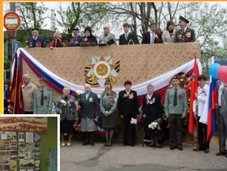
Парад ко Дню Победы