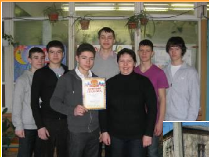
Победители в игре «Зарница»