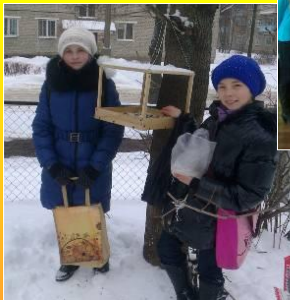
Акция «Птичья столовая»