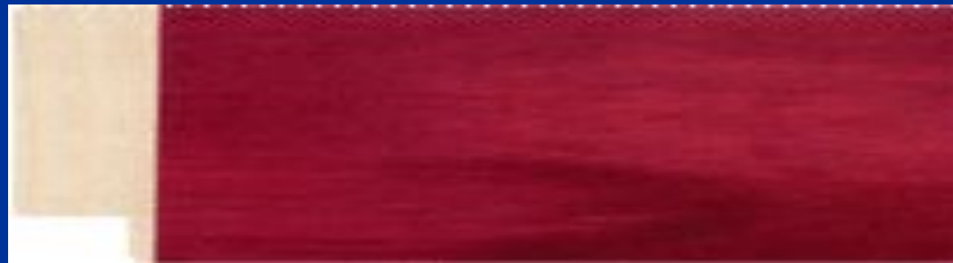
Рис.1. ПЛОСКИЙ ПРОФИЛЬ