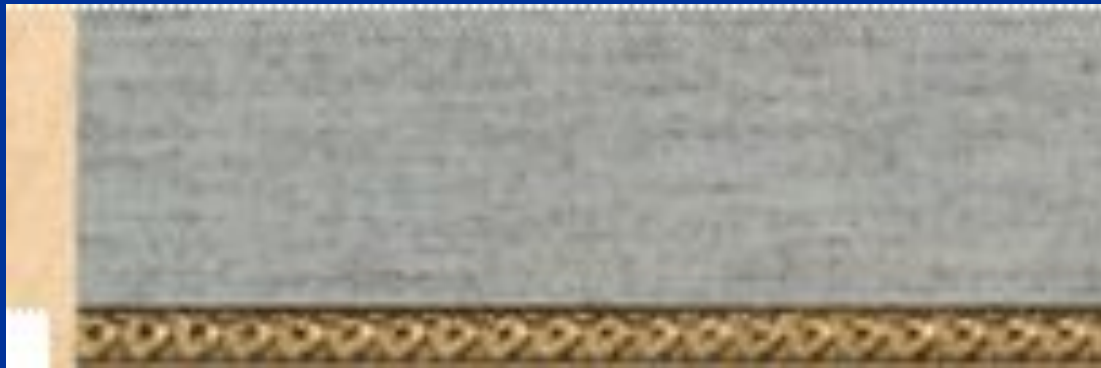
Рис.12. Профиль – паспарту