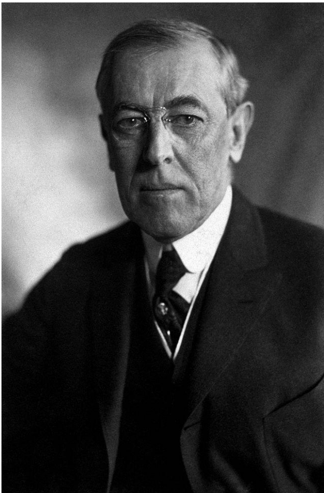
Вудро Вильсон (1913 – 1921)

США. Самая мощная держава мира. Быстрый рост промышленного производства, увеличение численности населения (за счет иммигрантов), улучшение благосостояния граждан, рост городов, строительство небоскребов, автомобилизация страны. Доллар – самая сильная мировая валюта.