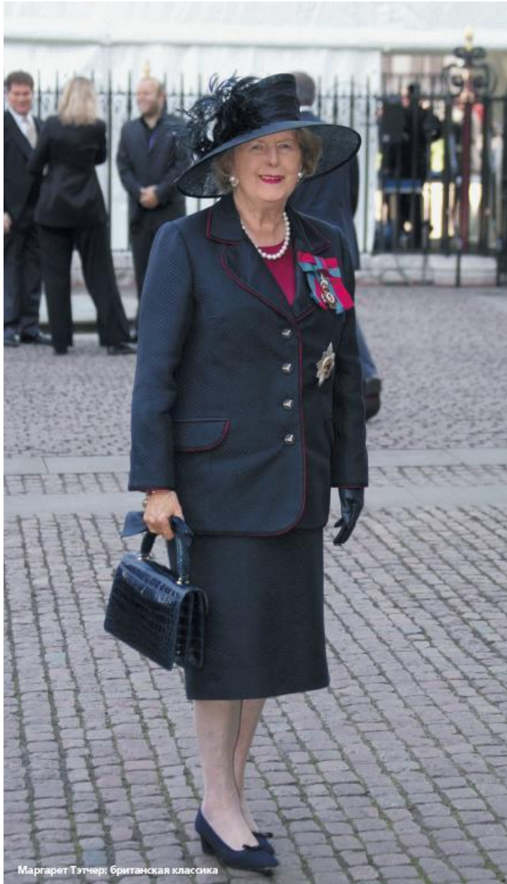
Маргарет Тэтчер: британская классика