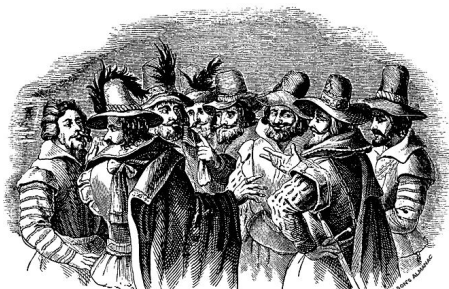
Bates. R. Winter. C. Wright. J. Wright. Percy. Fawkes. Cateby. T. Winter. THE GUNPOWDER CONSPIRATORS—FROM A PRINT PUBLISHED IMMEDIATELY AFTER THE DISCOVERY.

После этого заговорщики решили не отменять операцию государственного переворота.