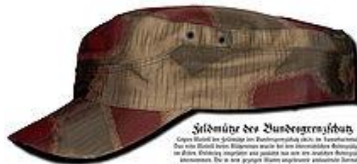
Söldmütze des Bundesgrenzschutzes

Слова Söldmütze и Söldmütze (ср. н.-в.-германское) означают «шапка» и «шапка» соответственно. Это слово использовалось в 19-м и 20-м веках для обозначения шапки, которую носили солдаты. Это слово использовалось в 19-м и 20-м веках для обозначения шапки, которую носили солдаты.