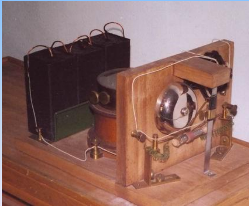
Радиоприёмник Попова. 1895г. Копия. Политехнический музей. Москва.