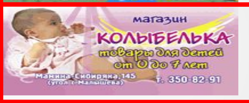
Размер 18x7 см