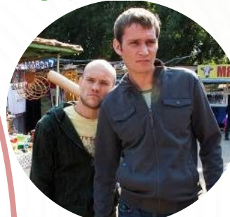
БЕЗРАЗЛИЧНЫЕ / «АМЕБНЫЕ»