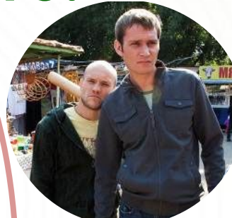
БЕЗРАЗЛИЧНЫЕ / «АМЕБНЫЕ»