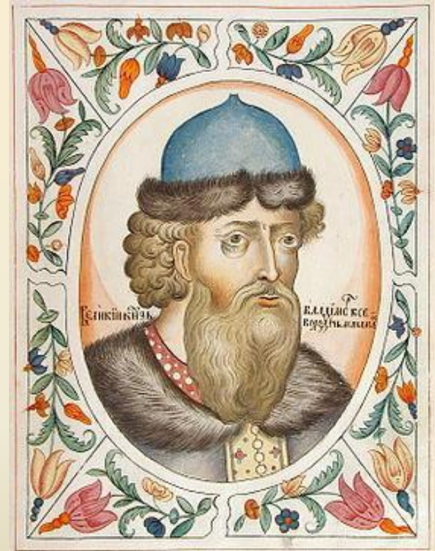
ВОЛОДИМИР МОНОМАХ. ПОРТРЕТ З ЦАРСЬКОГО ТИТУЛЯРНИКА. 1672 Р.