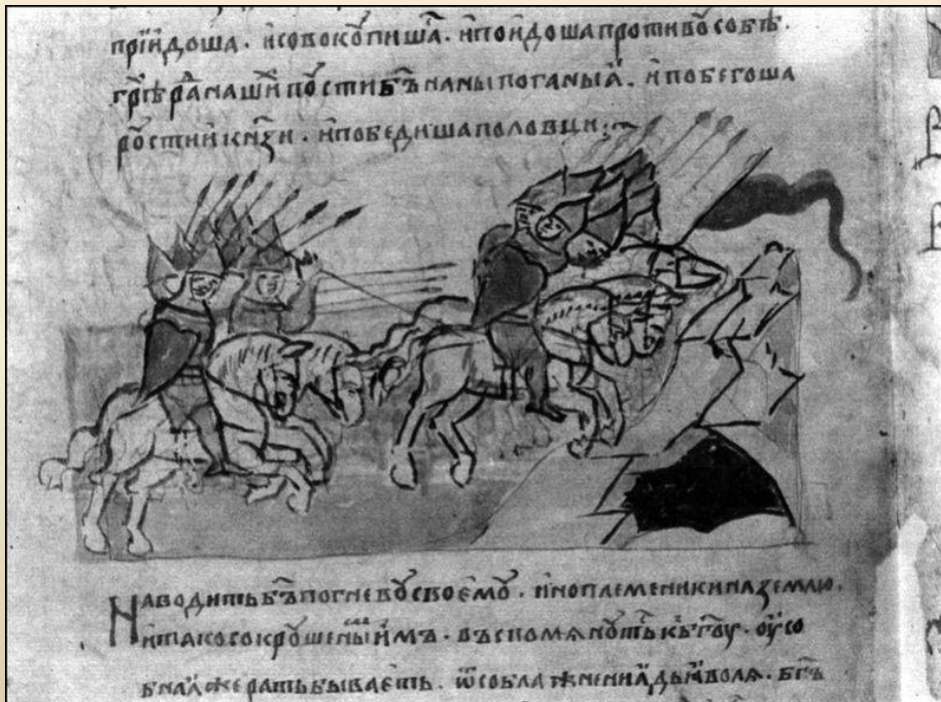
Битва на р. Альта. Мініатюра з Радзивілівського літопису

У РІК 6576 [ 1068]. Прийшли іноплеменники на Руську землю, половці многі. А Ізяслав, і Святослав, і Всеволод вийшли супроти них на [річку] Альту. І коли настала ніч, рушили вони одні проти одних. За гріхи наші напустив бог на нас поганих, і побігли руські князі , і перемогли половці.