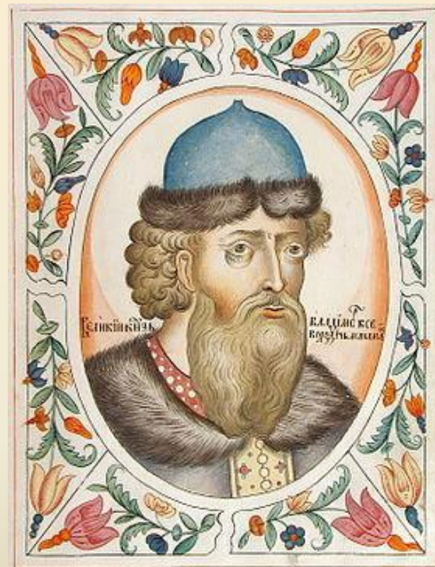
ВОЛОДИМИР МОНОМАХ. ПОРТРЕТ З ЦАРСЬКОГО ТИТУЛЯРНИКА. 1672 Р.