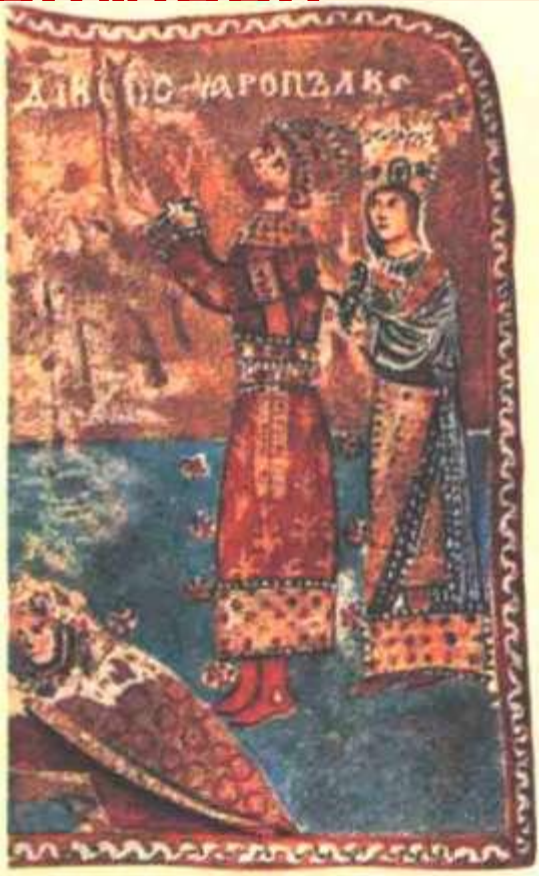
Князь Ярополк з дружиною Іриною. Фрагмент мініатюри з Трірського псалтиря (Німеччина)

Ярополк Ізяславич , син київського князя Ізяслава Ярославича, князь волинський і турівський, був одружений з Кунегундою-Іриною, дочкою графа Оттона. 1073 р. разом із батьком (князем Ізяславом) його вигнали з Києва, тому вони подалися по допомогу до Польщі, згодом до імператора Священної Римської імперії Генріха IV і нарешті — до Папи Григорія VIII. Однак ніхто не допоміг Ярополку та Ізяславу.