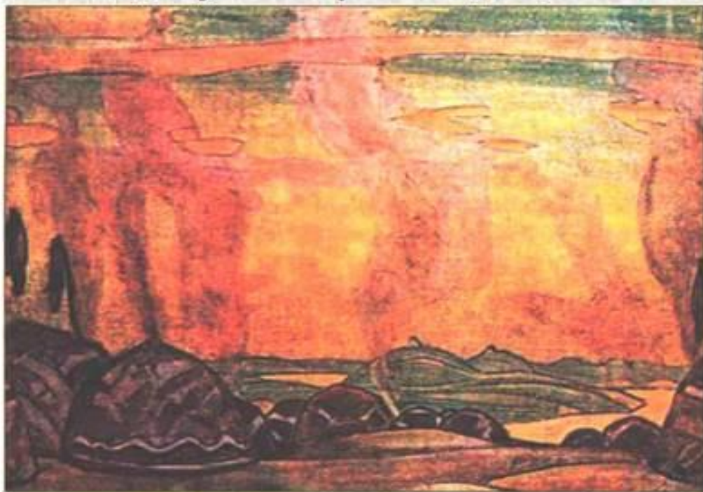
М. Періх. Половецький стан

Половці — тюркський кочовий народ, який в XI-XIII ст. населяв степи між Дунаєм і Волгою, у тому числі Крим і басейн Дону та Сіверського Дінця.