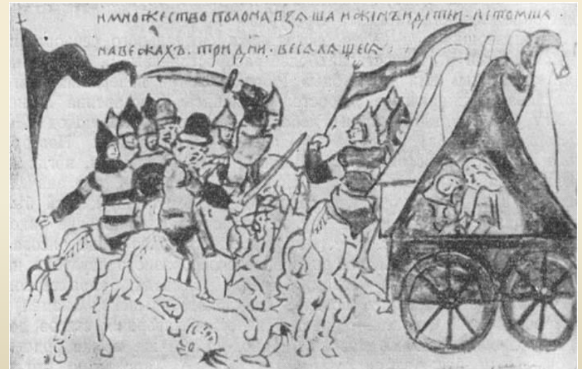
Бій руської дружини з половцями.