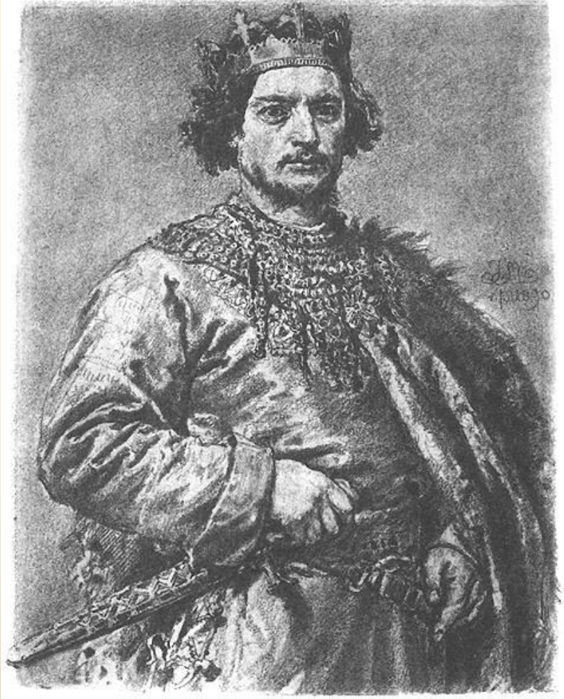
Болеслав II Сміливий. Портретна фантазія Яна Матейко

Навесні 1069 р. Ізяслав разом із братом своєї дружини, польським королем Болеславом II Сміливим , рушив на Київ. Кияни знову організували ополчення і спільно з дружиною і князем Всеславом пішли назустріч ворогам до м.Білгорода.