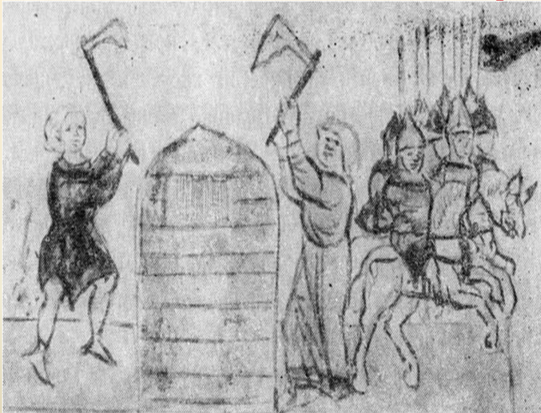
Мініатюра з Радзивілівського літопису

Визволення Всеслава сталося 14 вересня 1068 року , в день Воздвиження. Саме тому у зміщенні зі стола князя-клятвовідступника (Ізяслава) частина населення, і церковної знаті могла вбачати промисел Божий. Ізяслав із братом Всеволодом Ярославичем переяславським утекли з князівського палацу, тут же розграбованого городянами, що взяли