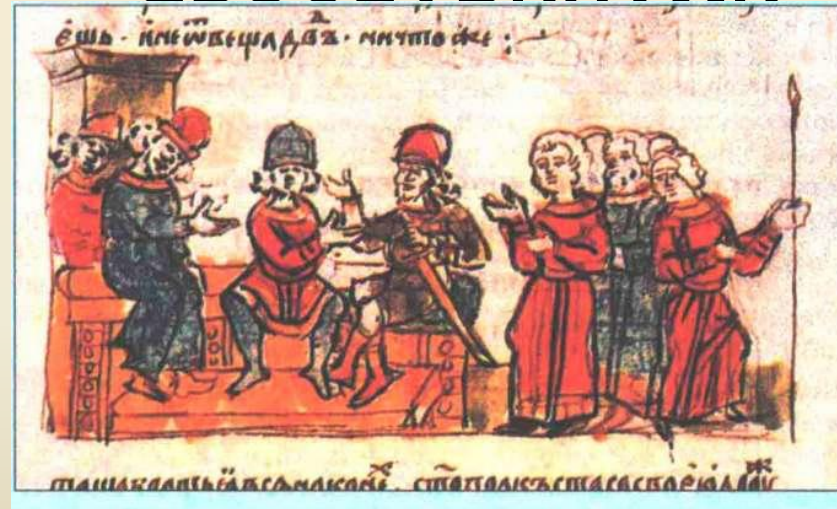
З'їзд руських князів під Києвом. Мініатюра з Радзивіллівського літопису

1072 Р. – М. ВИШГОРОД – “ ПРАВДА ЯРОСЛАВИЧІВ” – ЗМІНИ, ВНЕСЕНІ ДО РУСЬКОЇ ПРАВДИ