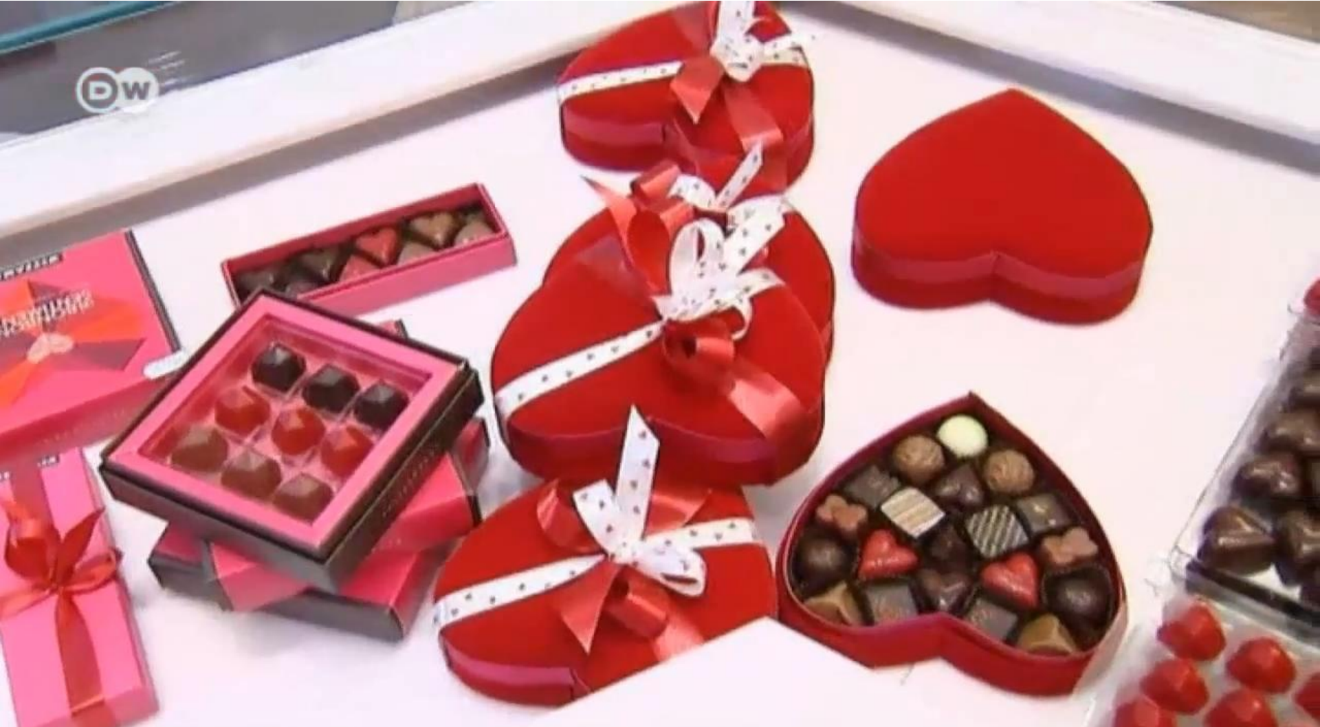
Valentine's Day in Germany - Euromaxx.mp4

Can you tell something interesting about what you see?