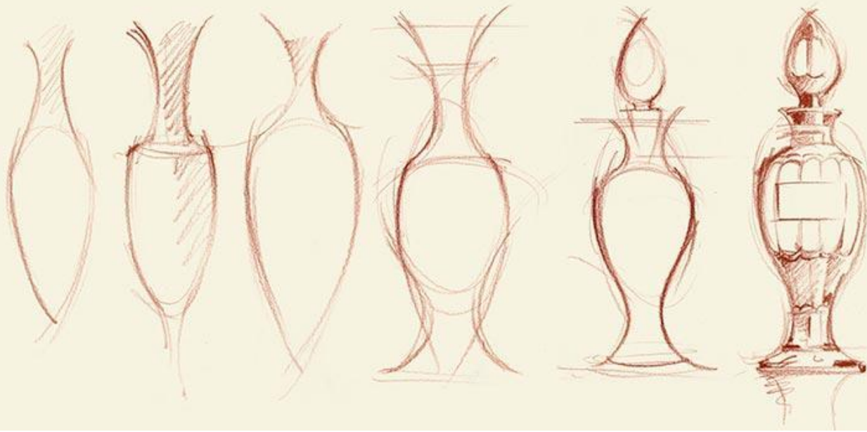
Création du premier parfum, Miss Dior, 1947