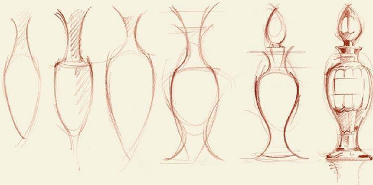
Création du premier parfum, Miss Dior, 1947