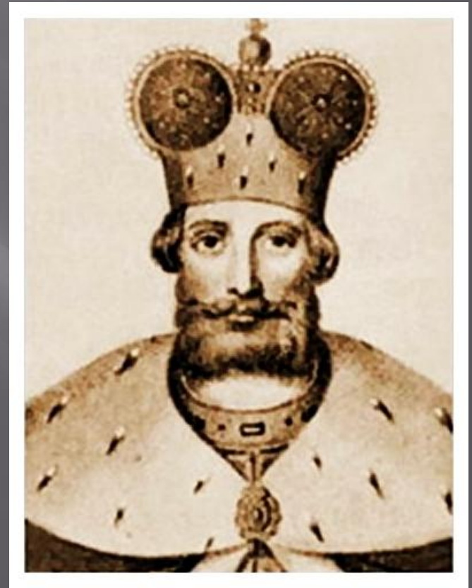
Князь Ярослав II Всеволодовича