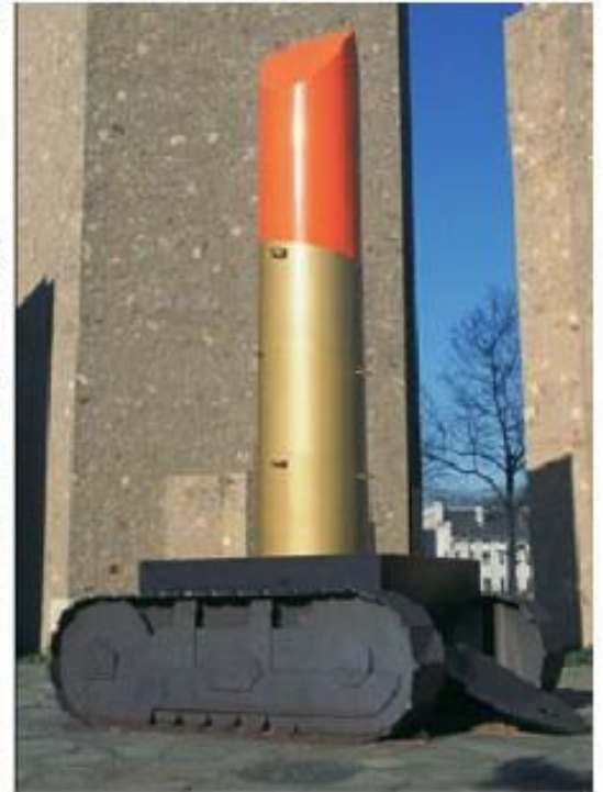
Andy Warhol, 100 Cans Campbell's Soup , 1962. Richard Hamilton, Just what is it that makes today's homes so different, so appealing? , 1956. Claes Oldenburg, Lipstick (Ascending) on Caterpillar Tracks , 1969-74.