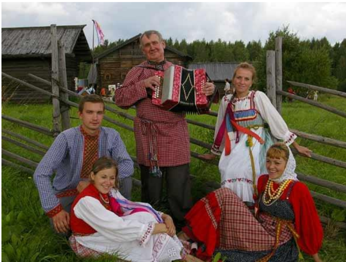
Фестиваль русской культуры стартовал в Удмуртии