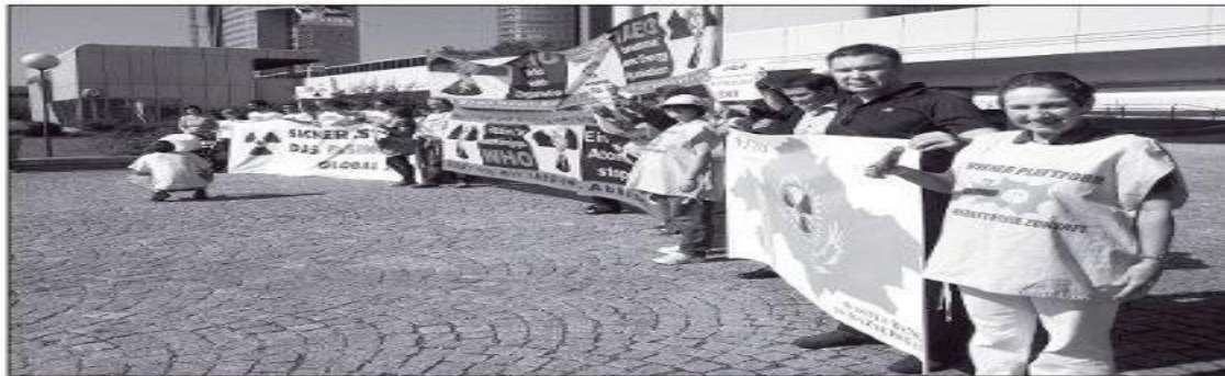
У ЗДАНИЯ МАГАТЭ в Вене прошел пикет, организованный совместными усилиями казахстанской партии «зеленых» и австрийского антиядерного движения «Глобал 2000».

В сентябре Казахстан в очередной раз подтвердил свою жажду поучаствовать в