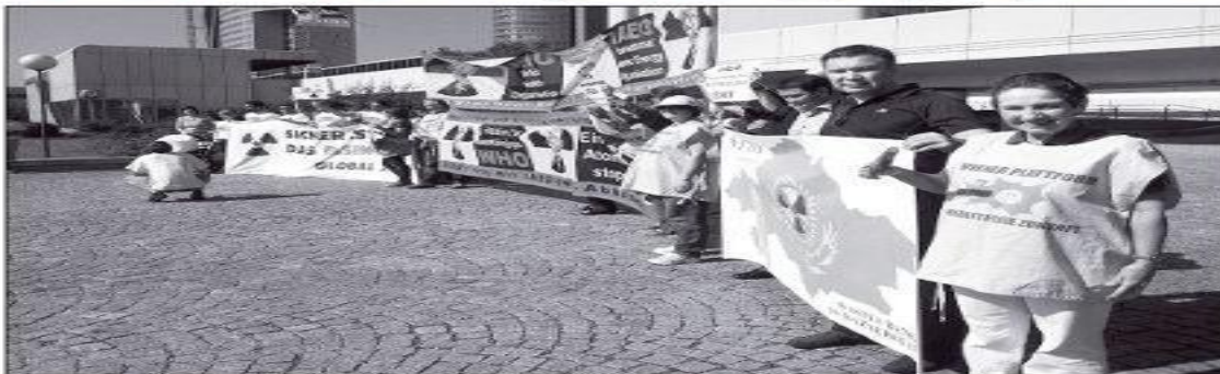
У ЗДАНИЯ МАГАТЭ в Вене прошел пикет, организованный совместными усилиями казахстанской партии «зеленых» и австрийского антиядерного движения «Глобал 2000».

В сентябре Казахстан в очередной раз подтвердил свою жажду поучаствовать в