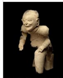
L2 Tolle seated figure, ceramic, h. 635 mm, 1st century BC–1st century AD (New York, Metropolitan Museum of Art, Gift of Gertrud A. Mellon, 1962, Accession ID: 1962.231)

Visit Tools & Resources to access Grove Art Online Timelines of World Art , designed to provide an overview of important moments in art history and the visual arts. Covering six geographic regions across the globe from 30,000 BC to the present, these illustrated timelines highlight a range of movements and moments, from Pre-Columbian sculpture to Mughal architecture to Pop art.