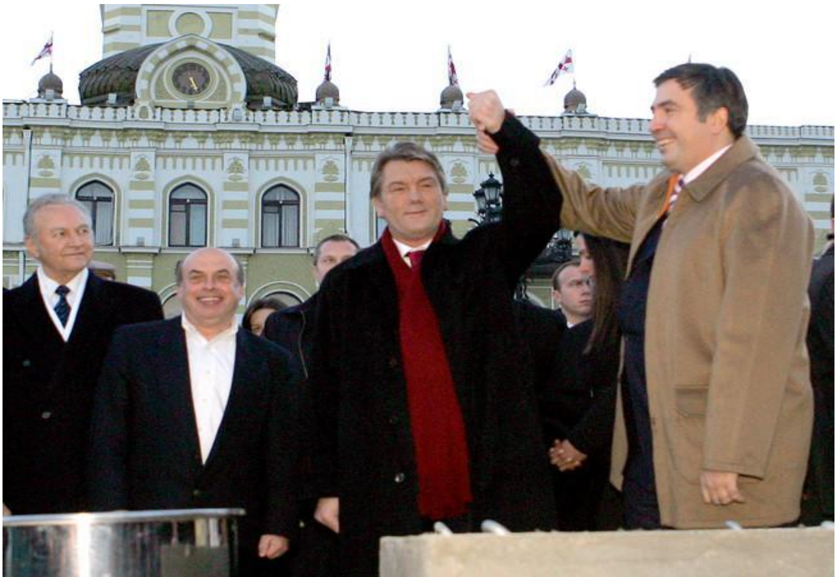
Президент Эстонии Арнольд Рюйтель, израильский министр по делам диаспоры Натан Щаранский, Президент Украины Виктор Ющенко и Президент Грузии Михаил Саакашвили принимают участие в церемонии закладки капсулы в фундамент Монумента Свободы