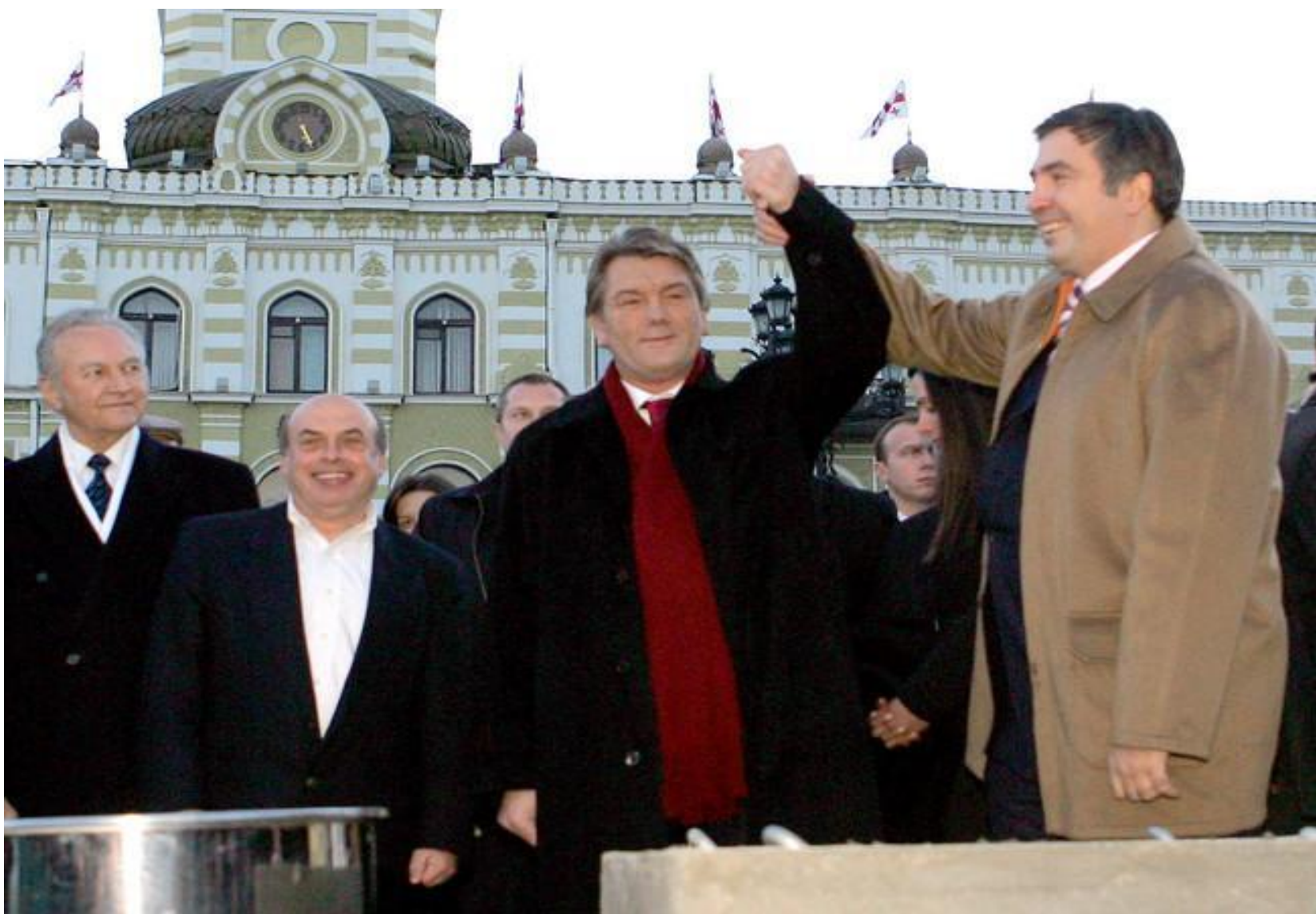
Президент Эстонии Арнольд Рюйтель, израильский министр по делам диаспоры Натан Щаранский, Президент Украины Виктор Ющенко и Президент Грузии Михаил Саакашвили принимают участие в церемонии закладки капсулы в фундамент Монумента Свободы