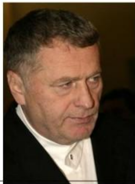
Владимир Вольфович Жириновский

Радикальная партия, выступающая за сильное государство, которому должны быть подчинены интересы всех его граждан.