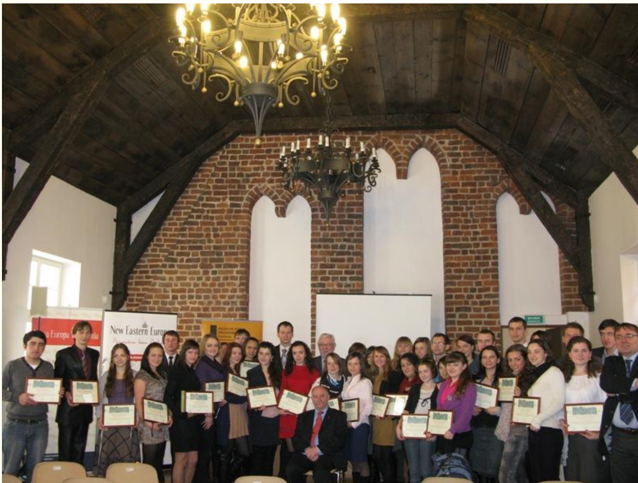
Участники IX Восточной зимней школы во время церемонии закрытия Школы (март 2012г.)