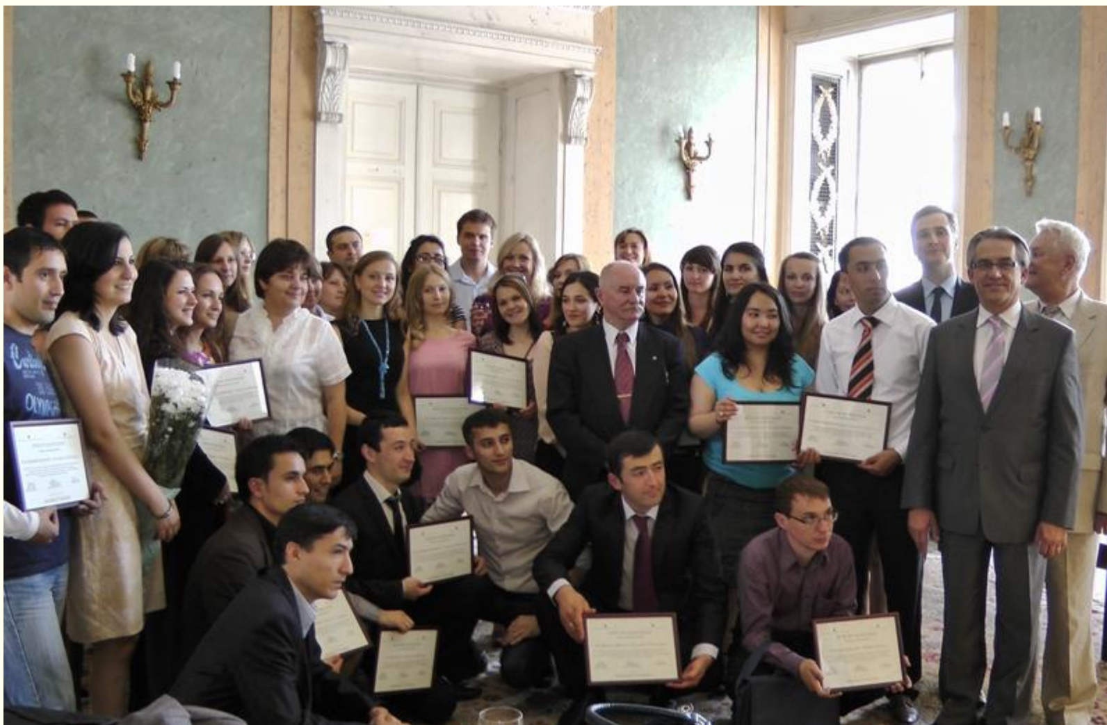
Стипендиаты Стипендиальной программы Правительства Республики Польша для Молодых Ученых (академический год 2011/2012) во время вручения дипломов.