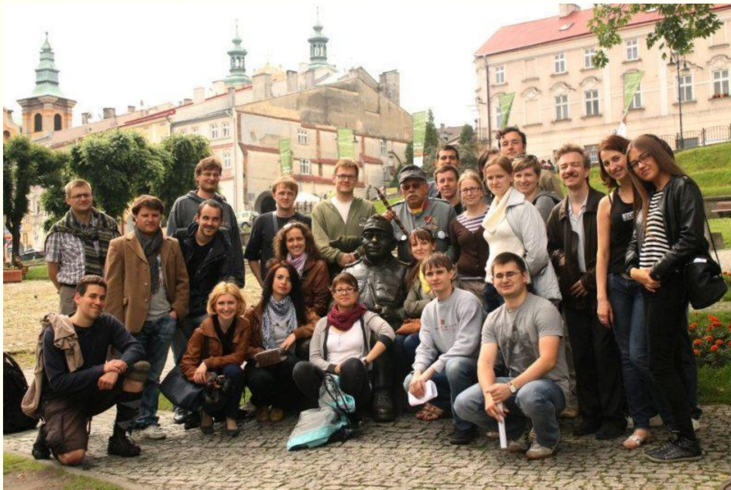
Стипендиаты Стипендиальной программы „25 Стипендий” и преподаватели Центра исследований Восточной Европы во время „научного тура” по Польше (Пшемысль, июнь 2012г.)