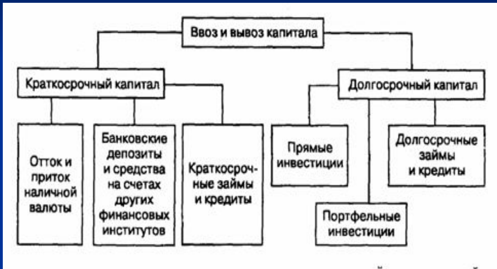
Рис. 1. Основные формы международного перемещения капитала