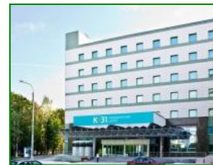
Медицинский Центр «Клиника+31», г. Москва