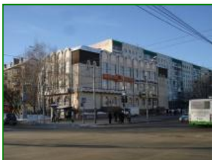
Торгово-офисное здание, г. Тюмень