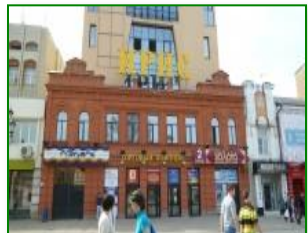
Торговый центр «Ирис», г. Саратов