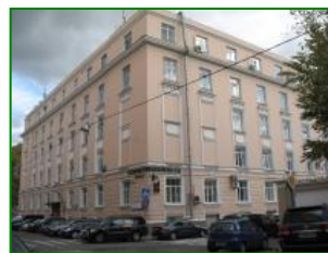
Офисный центр на ул. Александра Солженицына, д.27, г.Москва