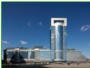
Деловой центр «Северная Башня», ММДЦ «Москва- Сити»