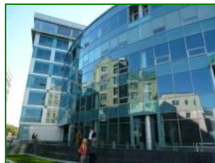
Бизнес центр класса В+ «Святогор», г. Москва