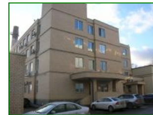
Фармацевтический офисно-складской комплекс «Долгопрудный», г. Долгопрудный МО