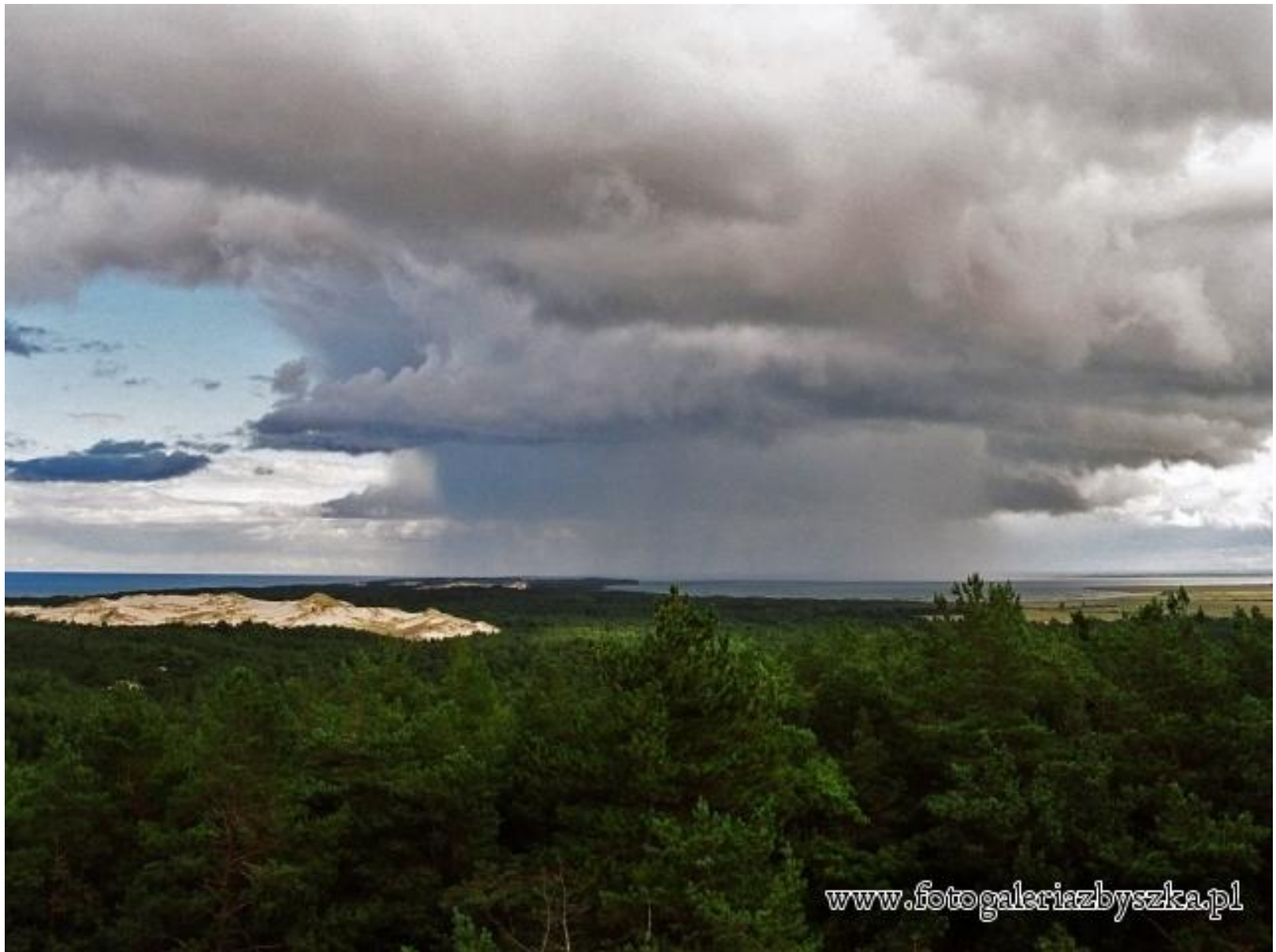
Słowiński Park Narodowy