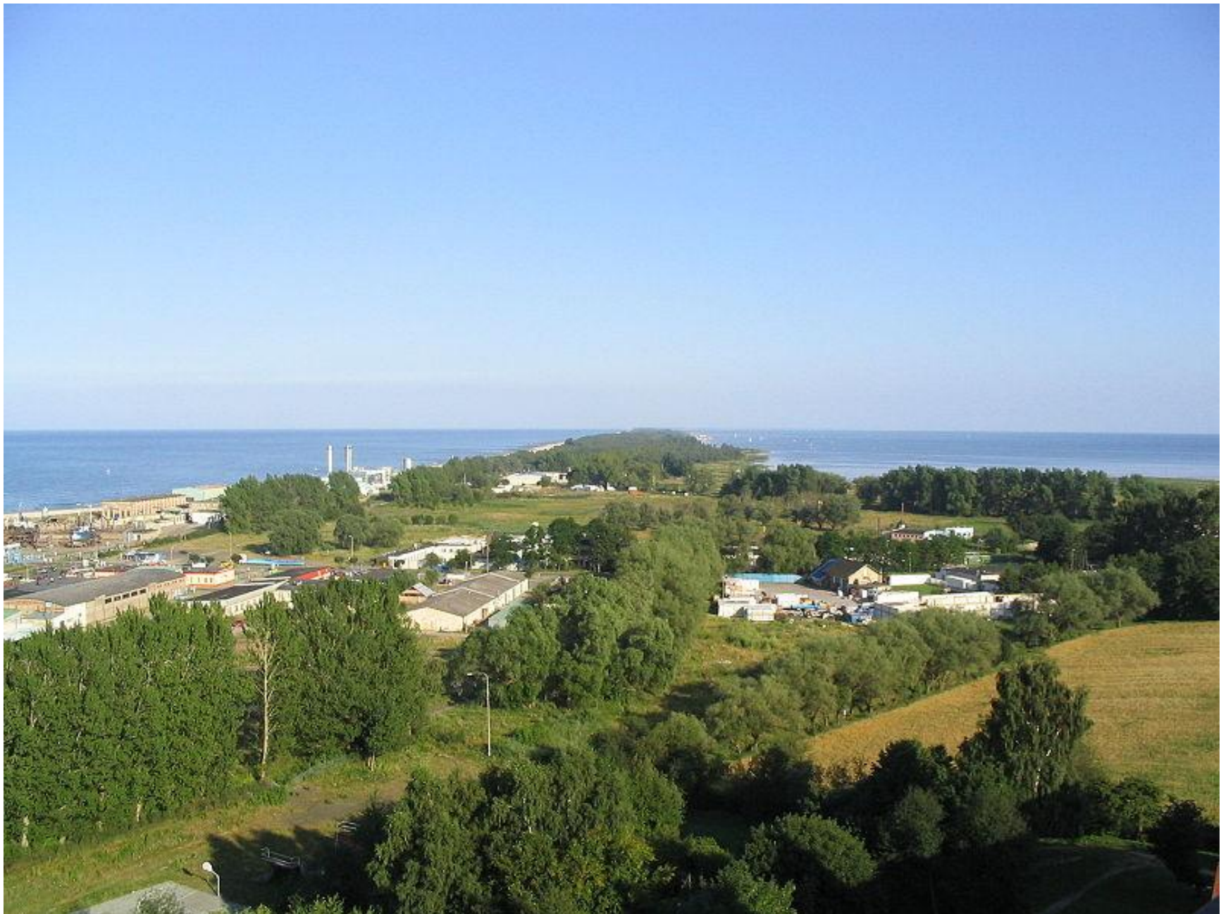
Władysławowo – widok na Mierzeję Helską