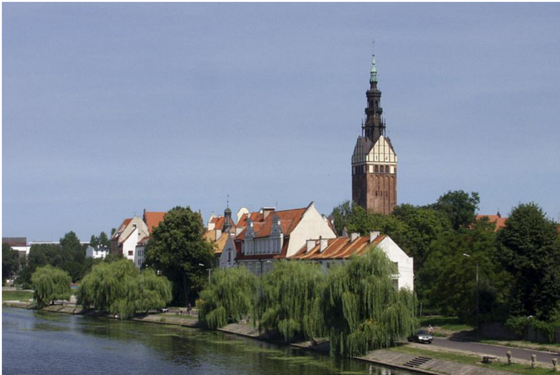
Elbląg – Stare Miasto.