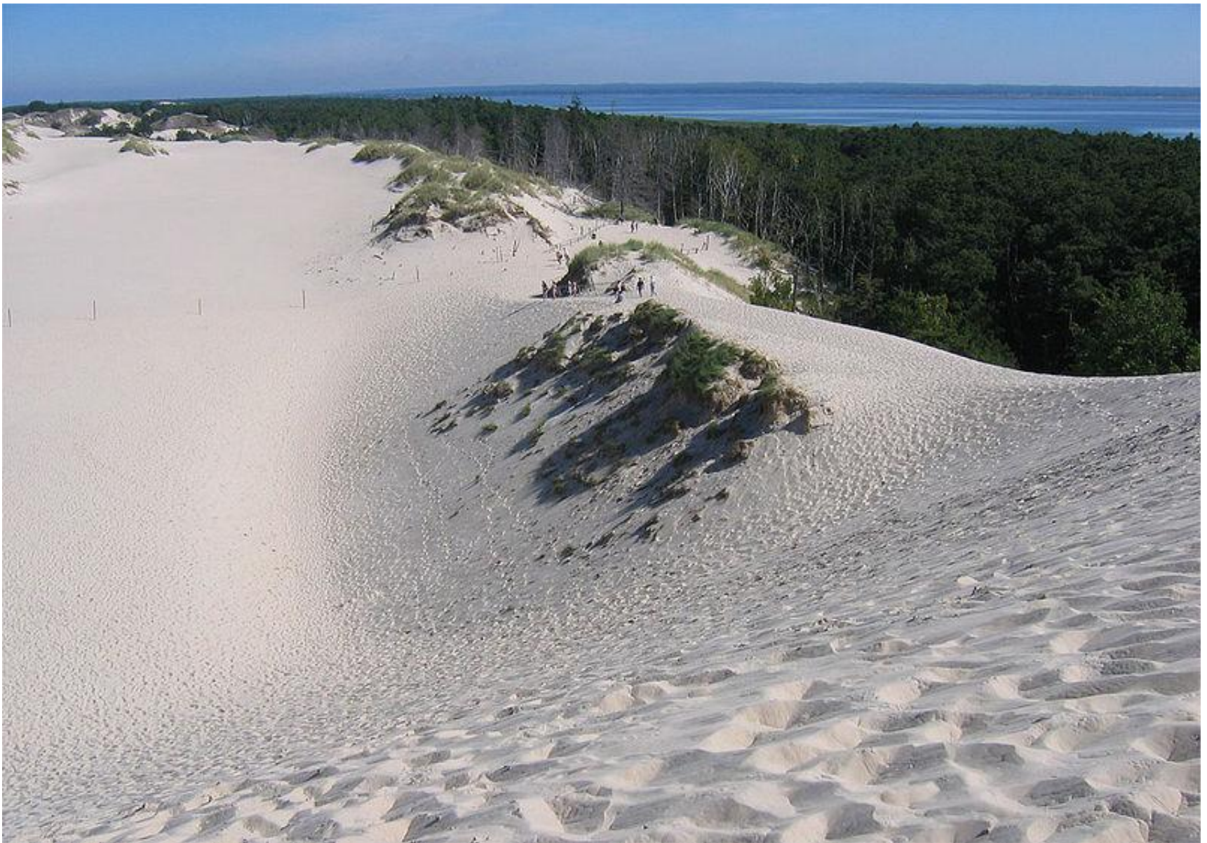
Słowiński Park Narodowy