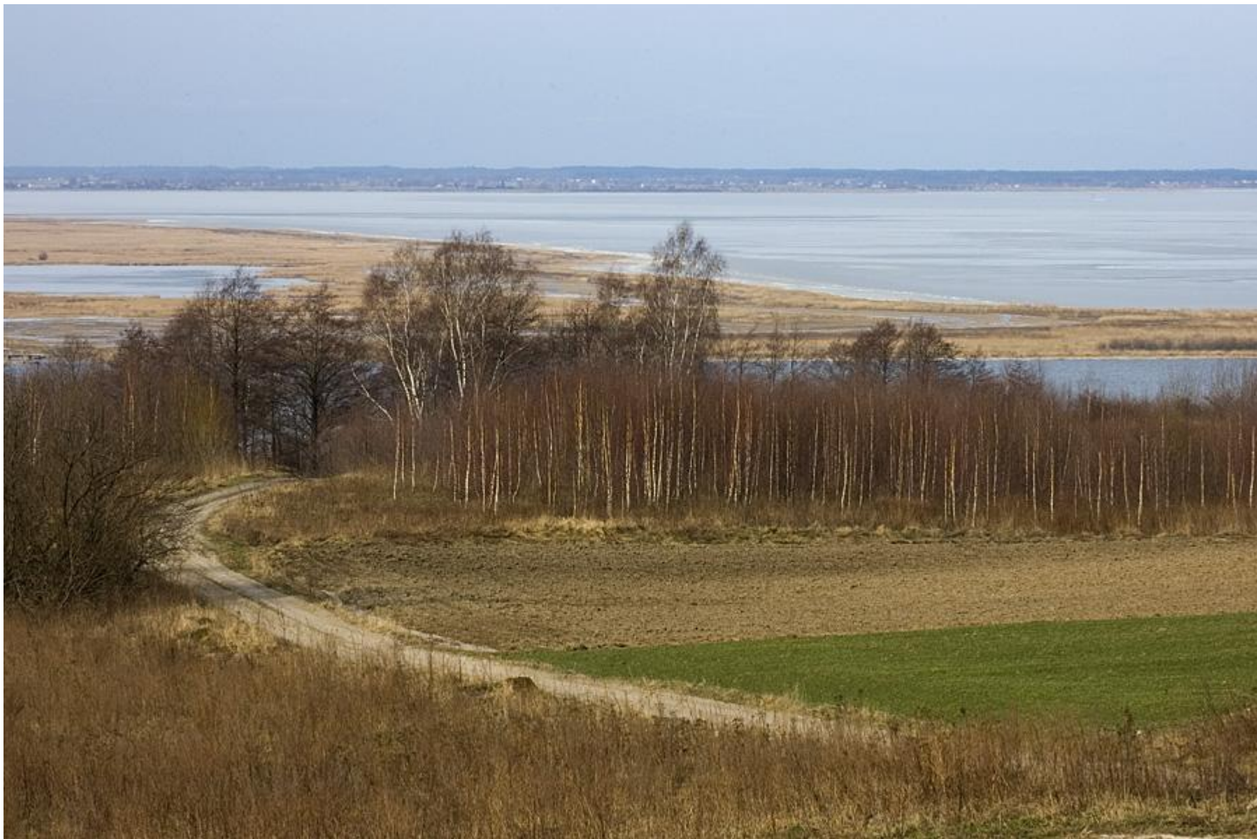
Widok z Wysoczyzny Elbląskiej na Zalew Wiślany.