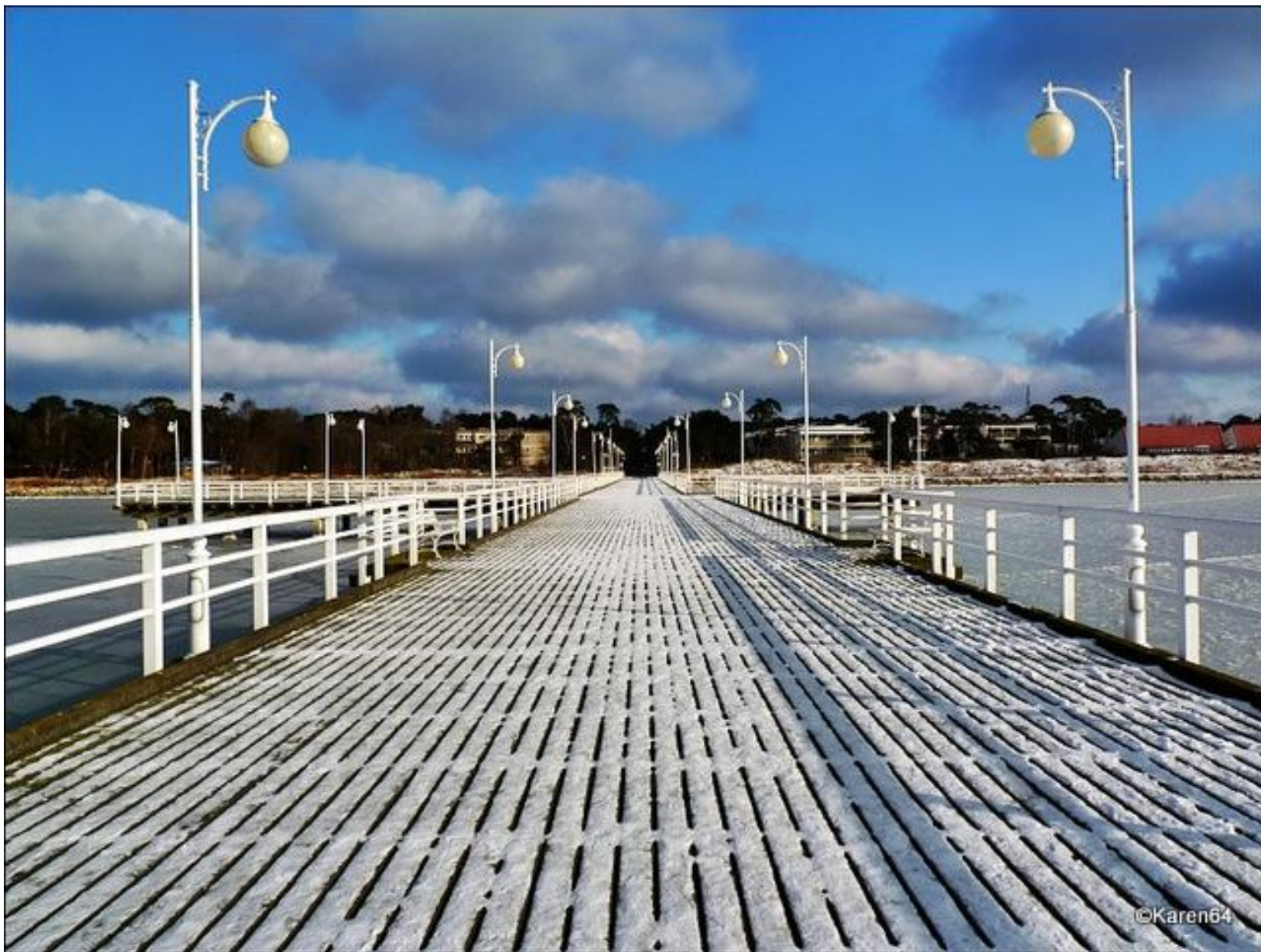
Jurata molo Jedna z najmodniejszych miejscowości wczasowych Polski międzywojennej