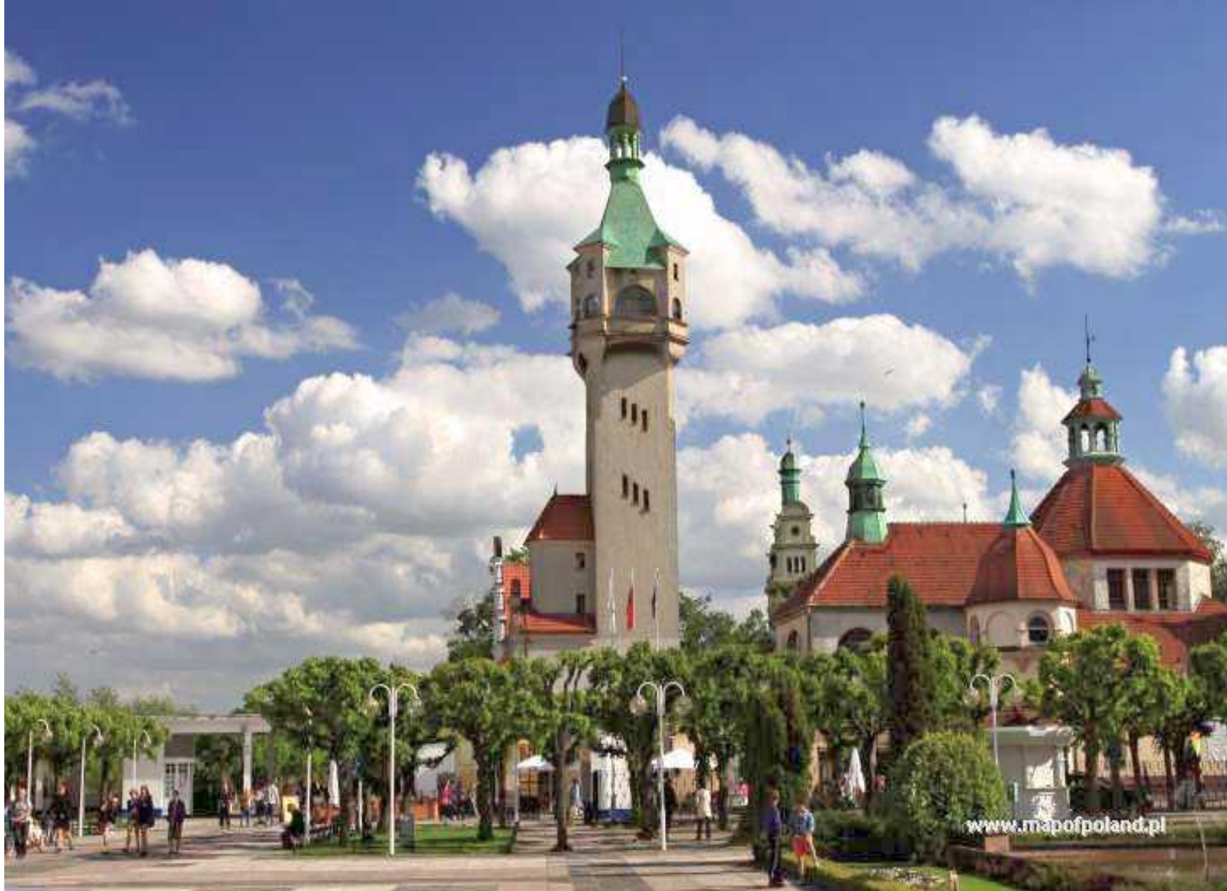
Sopot - latarnia morska Kurort powstał w I połowie XIX wieku. Słynne moło 500m Deptak Monte Cassino, Festiwal piosenki w Operze Leśnej