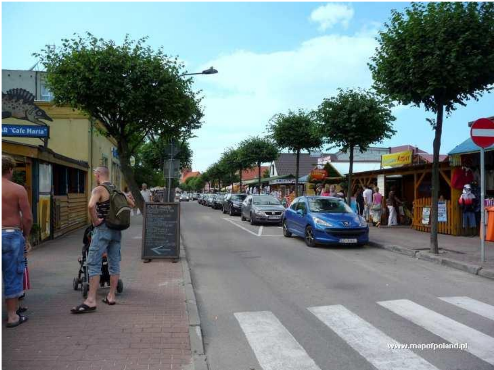
Jastarnia – główna ulica.