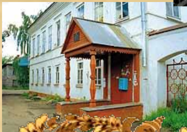
Старинный особняк, где мог жить Сквозник-Дмухановский