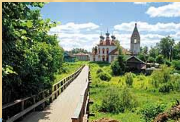
Почти центр города...

Ю.Манн, литературовед: «Сила «Ревизора» в том, что это особый город. Все нормы общежития, обращения людей друг к другу выглядят как повсеместные..Перед нами весь мир русской жизни, «вся Русь»