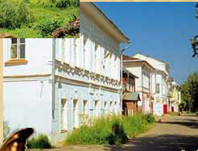
Улица со старыми домами, по которой могли гулять герои «Ревизора»