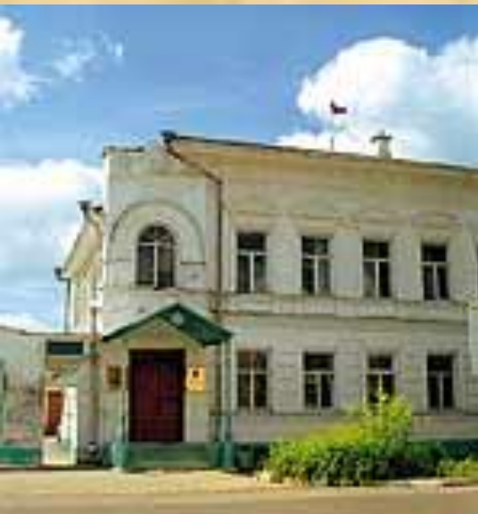
Дом администрации города, в котором мог управлять делами Городничий

Городничий: «Да отсюда, хоть три года скачи, ни до какого государства не доедешь»