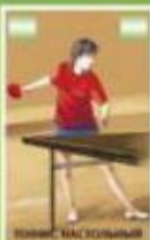
ТЕННИС НА СТОЛОВЫМ