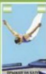
ПЬКЖИТ НА САДУ