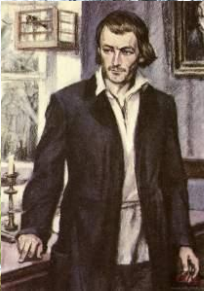
Евгений Васильевич Базаров

Лицо «длинное и худое, с широким лбом, кверху плоским, книзу заостренным носом, с большими зеленоватыми глазами и с висячими бакенбардами песочного цвету... оживлялось спокойной улыбкой и выражало самоуверенность и ум... Его темно-белокурые волосы, длинные и густые, не скрывали крупных выпуклостей просторного черепа».