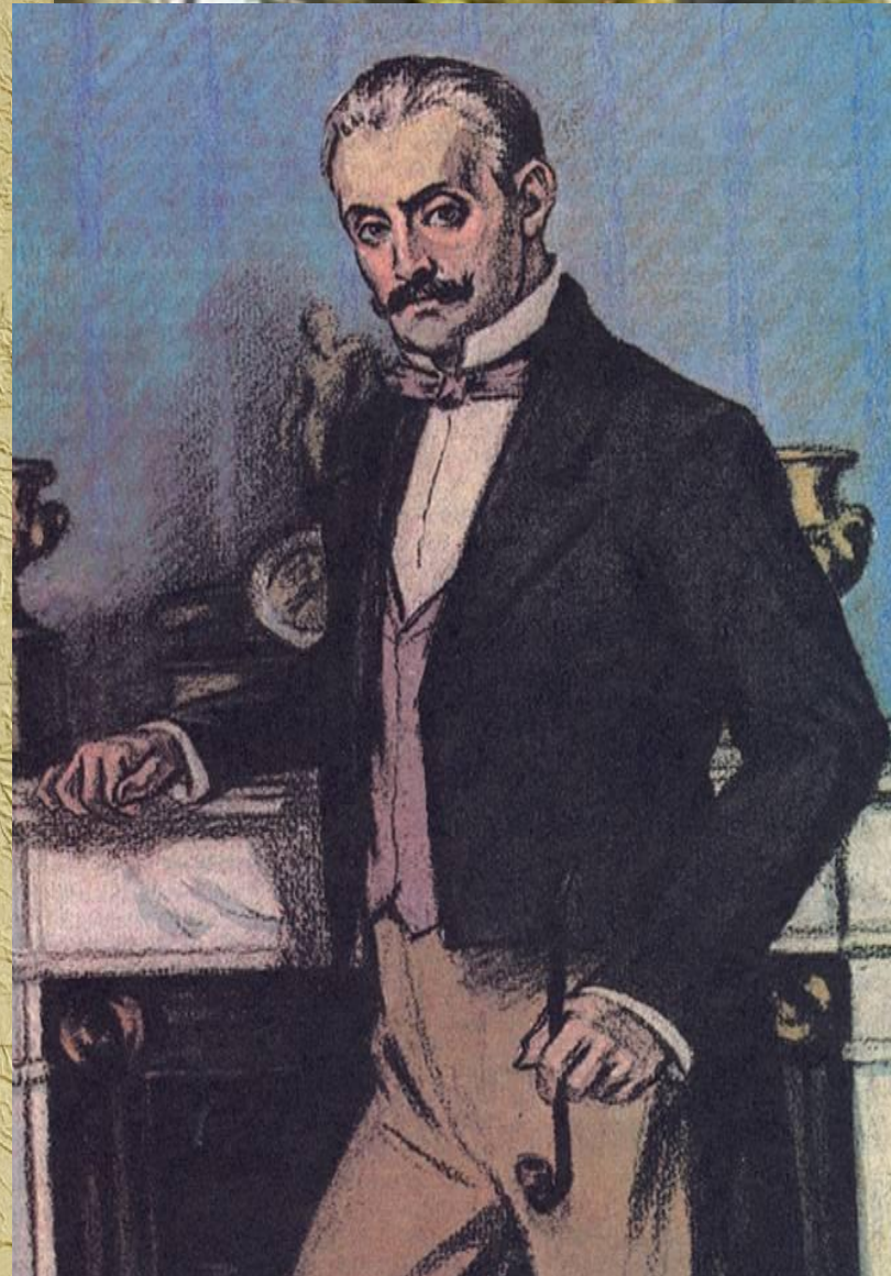
Павел Петрович Кирсанов

Аристократизм, изысканность вкусов, стремление к франтовству и желчность характера; архаичность и бессмысленность аристократизма сразу бросается в глаза. Однако совсем не порок, если за красивой внешностью скрывается глубокая натура. Весь вопрос в преувеличении внимания Павла Петровича к своей одежде.