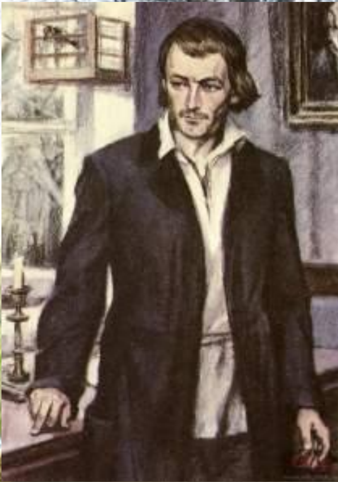
Евгений Васильевич Базаров

Лицо «длинное и худое, с широким лбом, кверху плоским, книзу заостренным носом, с большими зеленоватыми глазами и с висячими бакенбардами песочного цвету... оживлялось спокойной улыбкой и выражало самоуверенность и ум... Его темно-белокурые волосы, длинные и густые, не скрывали крупных выпуклостей просторного черепа».