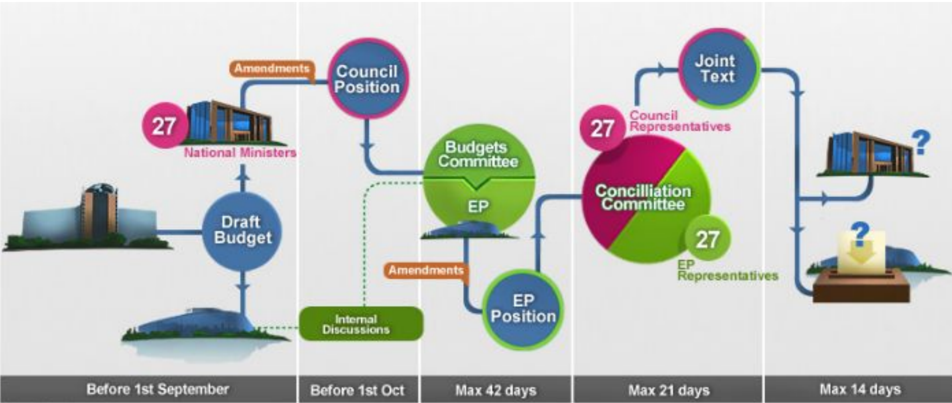
Lisbon Treaty's calendar